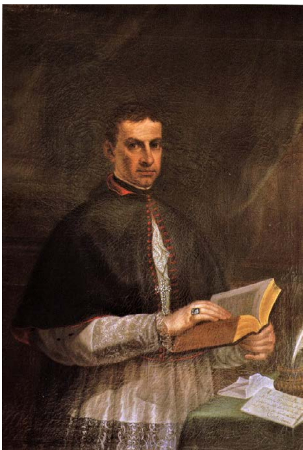
Fig. 01. Retrato de D. João de Mendonça, século XVIII, autor desconhecido; óleo sobre tela; 121 x 89,7 cm; Museu Francisco Tavares Proença Júnior, Castelo Branco (fot. de José Pessoa, 2000, Direcção-Geral do Património Cultural (DGPC), «www.matriznet.dgpc.pt»).