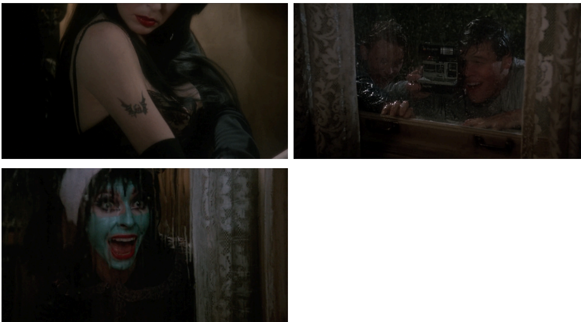
Figuras 1, 2 e 3: Fotogramas da cena em que Elvira é observada pelos adolescentes.

Mais do que apenas mostrar uma personagem-mulher forte e confiante em si, a narrativa várias vezes brinca com a ideia do que isso representa. Em um episódio, logo após se mudar para a mansão da tia, Elvira é espiada por um grupo de adolescentes que tentam vê-la a se despir pela janela do segundo andar para tentar tirar uma fotografia, mas são pegos de surpresa quando ela surge em uma máscara facial e acaba por assustá-los. Elvira, em seguida, toma controle da situação e questiona os jovens se eles não têm nada melhor para fazer; acaba por receber deles a oferta de ajuda para reformar a casa e, após aceitar, fecha a janela nas mãos dos adolescentes, que despencam para o chão enlameado.