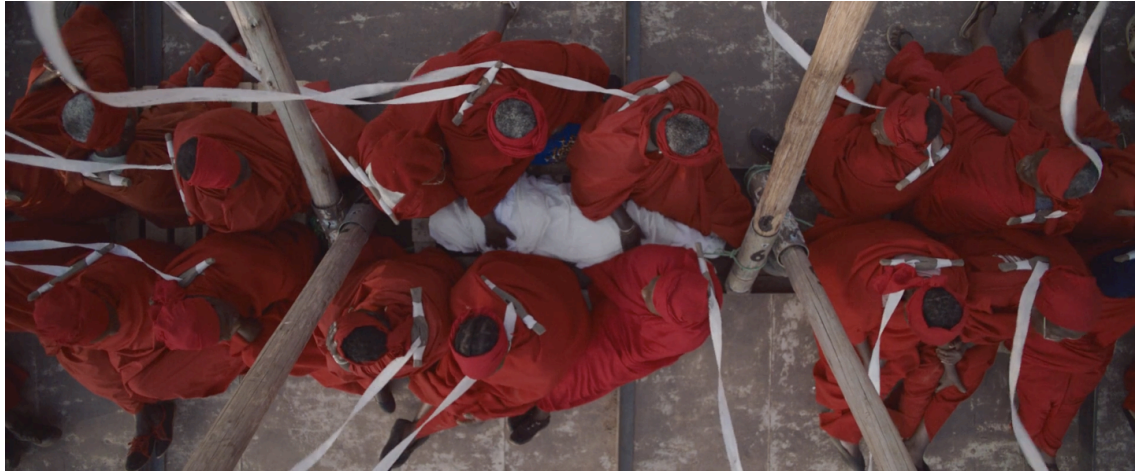
Figura 13: As bruxas mais velhas trajando vermelho cercam Shula, já falecida.

A imagem que fecha o filme é a de um caminhão vazio. Os carretéis, ainda pendurados em seus postes, têm as fitas livres a voar. Juntamente ao som do vento, também ouvimos o som de bodes. Shula está livre. Fica o questionamento: estariam as bruxas mais velhas também? Teria a passagem de Shula sido o suficiente para mudar sua complacência à situação em que foram colocadas?