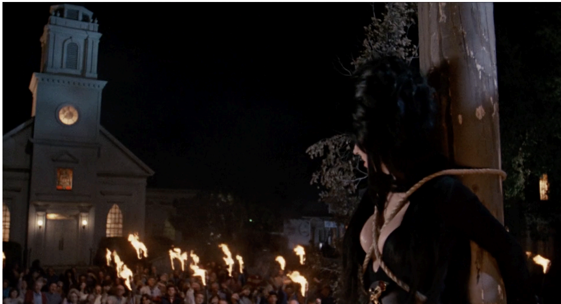
Figura 4: Fotograma de Elvira amarrada na fogueira em praça central, cercada dos moradores da cidade que carregam tochas em chamas.

Tendo explorado Elvira enquanto mulher, é agora possível nos virarmos para Elvira enquanto bruxa, e notar que pouco se altera no que se vem afirmando. A magia não é algo que ela busca, mas sim algo que lhe acontece acidentalmente. Um prato de jantar que ganha vida em forma de monstro; o cão e a própria mansão a servir como guias para que Elvira descubra o que há de escondido no prédio; uma caçarola enfeitiçada que tira toda a estimada moralidade do “clube da moralidade”. E mesmo sem entenderem exatamente como aquilo se passou, Elvira é logo a culpada de toda a situação. Não porque existem provas concretas, mas simplesmente porque seu tio Vincent (que é, por sua vez, um feiticeiro, insatisfeito por Elvira não ter lhe oferecido o “livro de receitas” de Morgana) sugere, em uma reunião do concelho da cidade, que a culpa seria obviamente da nova residente. Em cinco minutos o filme se transforma de peripécias atrapalhadas em uma caça às bruxas com direito à construção de uma enorme fogueira no centro da cidade para que executem a mulher.