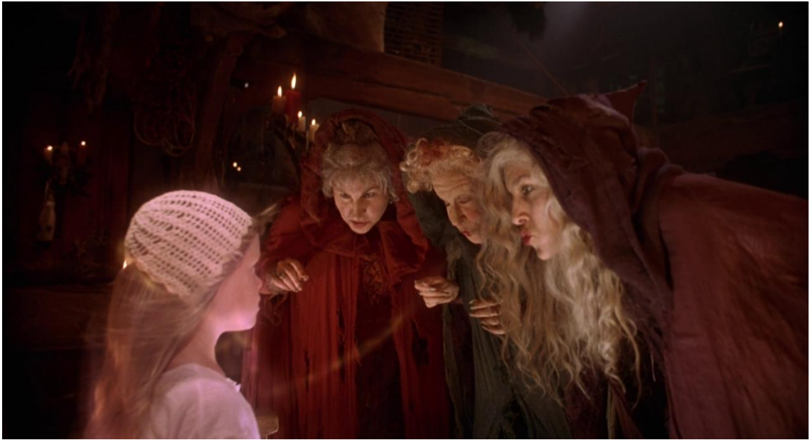
Figura 5: Irmãs Sanderson ao sugar a vida de Emily em busca de juventude.

incomum para as bruxas dos contos de fadas infantis, que em grande parte foram construídas diretamente a partir do imaginário popular das primeiras bruxas. Esse imaginário constata que o maior mal que uma mulher poderia cometer seria o de recusar a maternidade como um todo. Essa característica se manifesta nas irmãs quando elas têm como grandes opositoras todas as crianças e jovens presentes na narrativa. O ato de negar o senso de maternidade, negar a noção de querer proteger uma vida ainda jovem, é tido como inatural e seria suficiente para transformar qualquer mulher em bruxa.