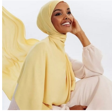
Figura 2 – Halima Aden