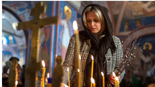
Figura 4 – Vestuário de uma mulher numa igreja ortodoxa

Relativamente à moda, embora esta cultura tenha tradições rígidas a nível religioso e culturas que por consequência se estende ao vestuário, conseguiu evoluir aos longo dos tempos.