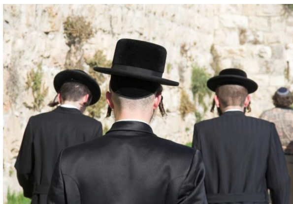
Figura 7 – Vestuário de homens judeus

Tal como nas outras religiões, a moda tem tentado evoluir dentro das mesmas, mas sempre seguindo os mesmos valores. Os designers evoluem e criam estilos mais contemporâneos, mas sempre com o cunho da religião. Ainda assim, é uma cultura onde as novas vozes tentam criar algum espaço para a inovação permitindo que cada judeu se expresse na sua fé mas também na sua identidade.