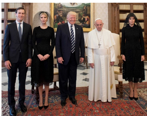
Figura 5 – Vestuário protocolar utilizado ao visitar o Papa

Embora existiam alguns membros católicos que tentem adaptar a sua escolha religiosa com estilos mais contemporâneos, a verdade é que o catolicismo conservador permanece ainda muito sólido e muitas vezes não está preparado para essa mudança.