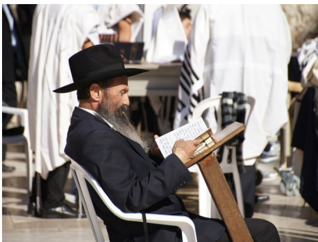
Figura 9 – Vestuário de um homem judeu com alguma idade