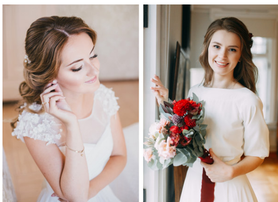
Figura 6 – Vestuário de noivas católicas