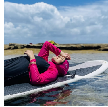
Figura 3 – Carrima Orra