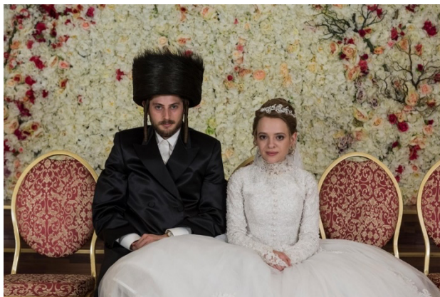
Figura 8 – Fotografia de um casamento entre dois judeus