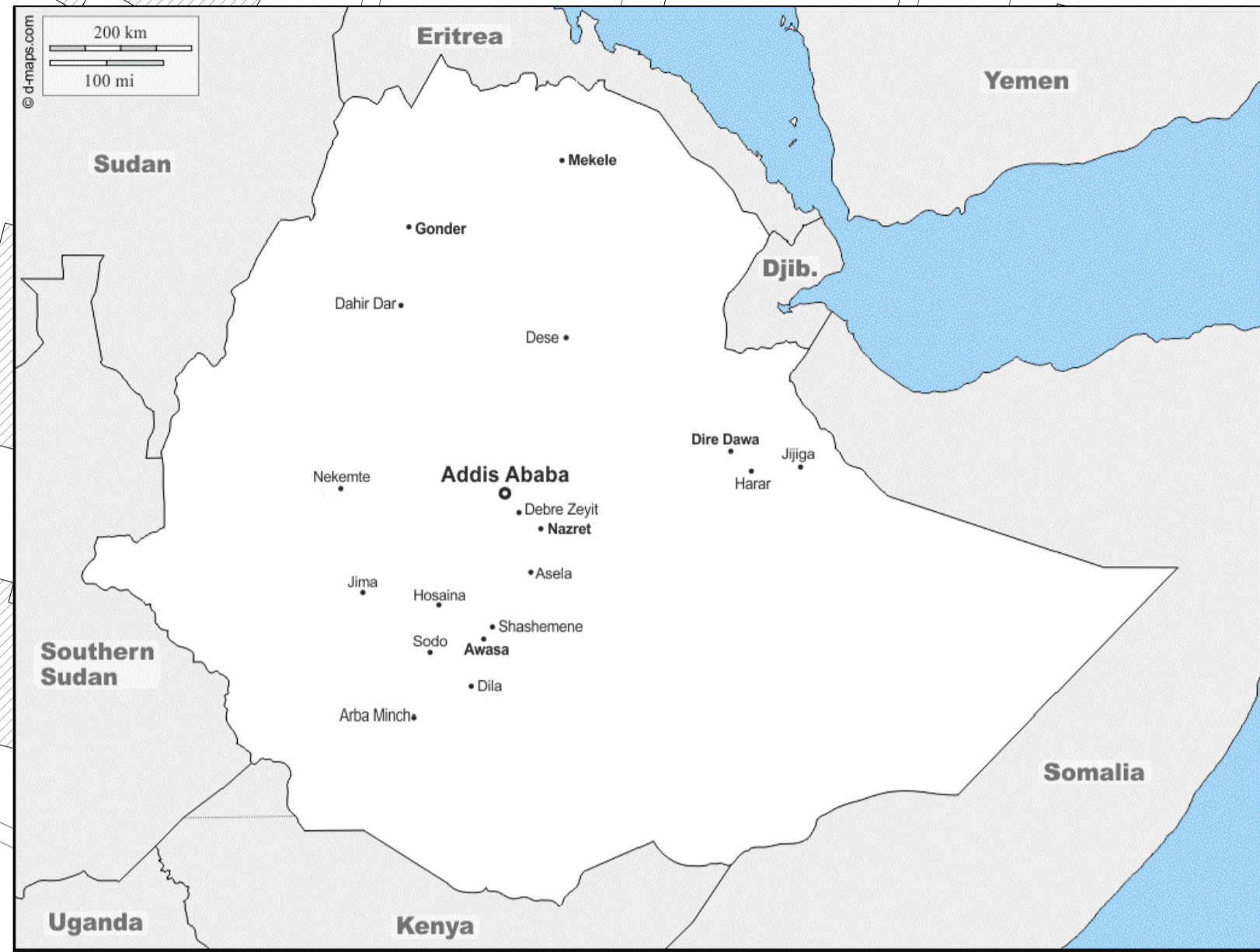
MAPA DA ETIÓPIA