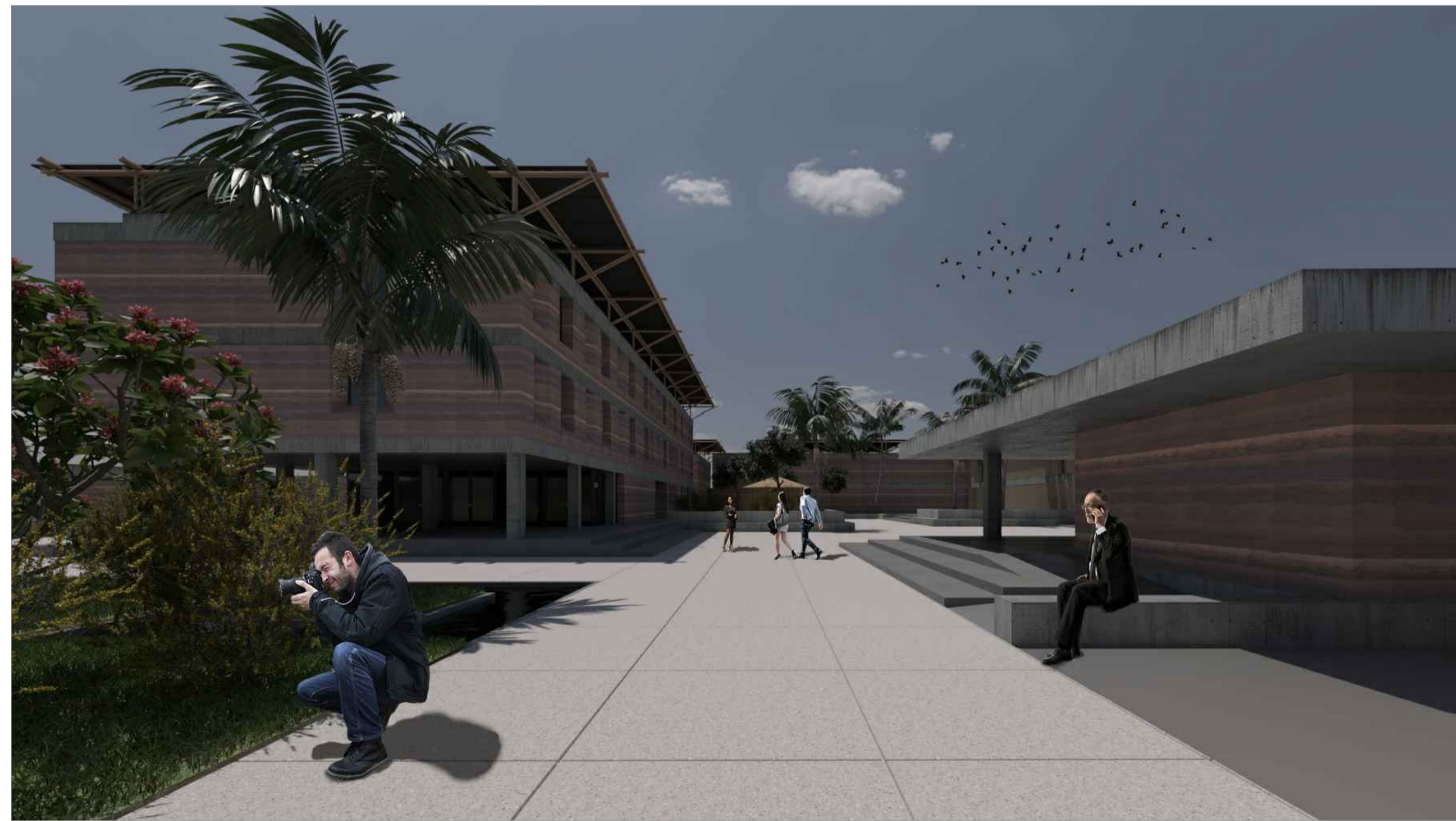
VISTA DA ENTRADA PRINCIPAL