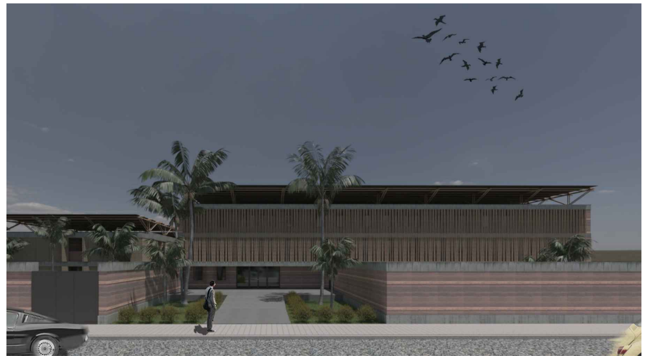
VISTA DA ENTRADA DO CONSULADO