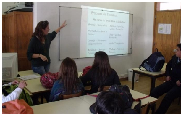
Ilustração LXVI: Aula de Formação Cívica dada pela professora estagiária