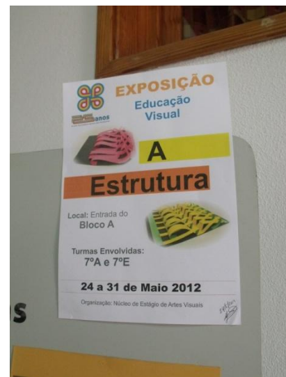
Ilustração LXV: Exposição trabalhos no âmbito da UT "A Estrutura".