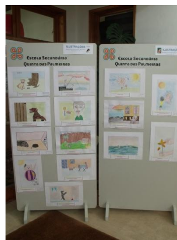
Ilustração LXII: Exposição sobre UT - “A Ilustração”