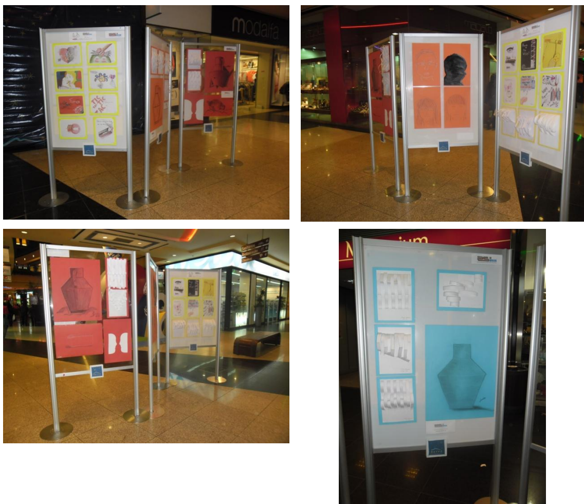
Ilustração LXIV: Exposição trabalhos no âmbito da semana Artíris.