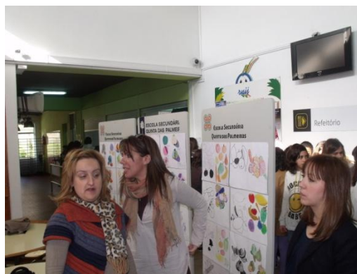
Ilustração LXI: Exposição sobre UT - “A Forma”