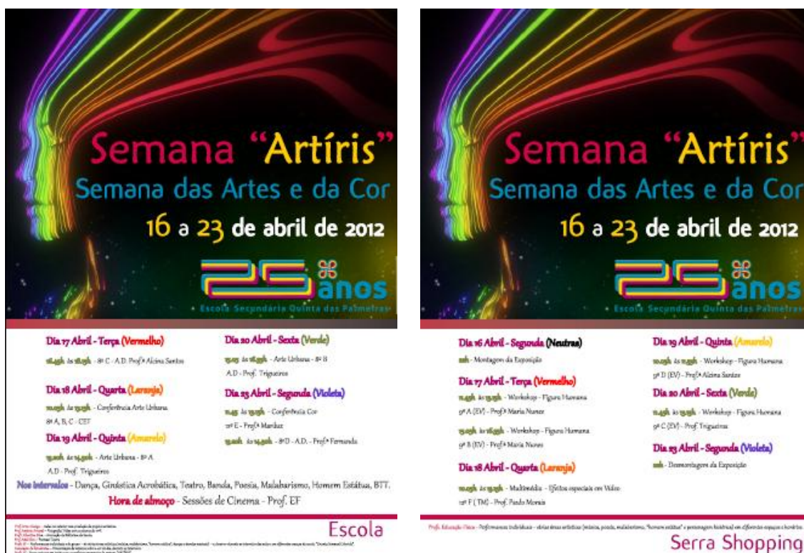
Ilustração LXIII: Cartazes de divulgação Semana Artíris 67

A semana “Artíris” representava as sete cores do arco-íris sendo designada a Semana das Artes e da Cor, pois cada dia representava uma cor. O grupo de estágio de Artes Visuais colaborou nesta semana expondo alguns trabalhos realizados com os alunos.