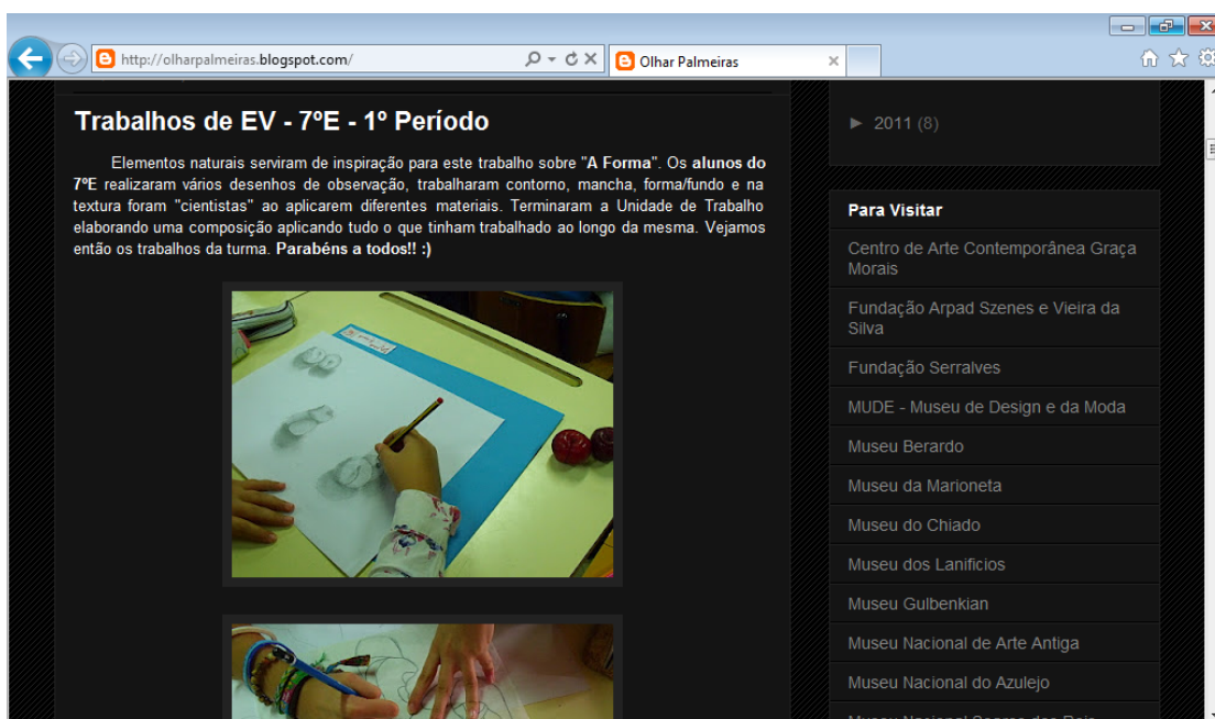
Ilustração LX: Faixa de divulgação do blogue e página oficial do mesmo. Disponível na página http://olharpalmeiras.blogspot.pt