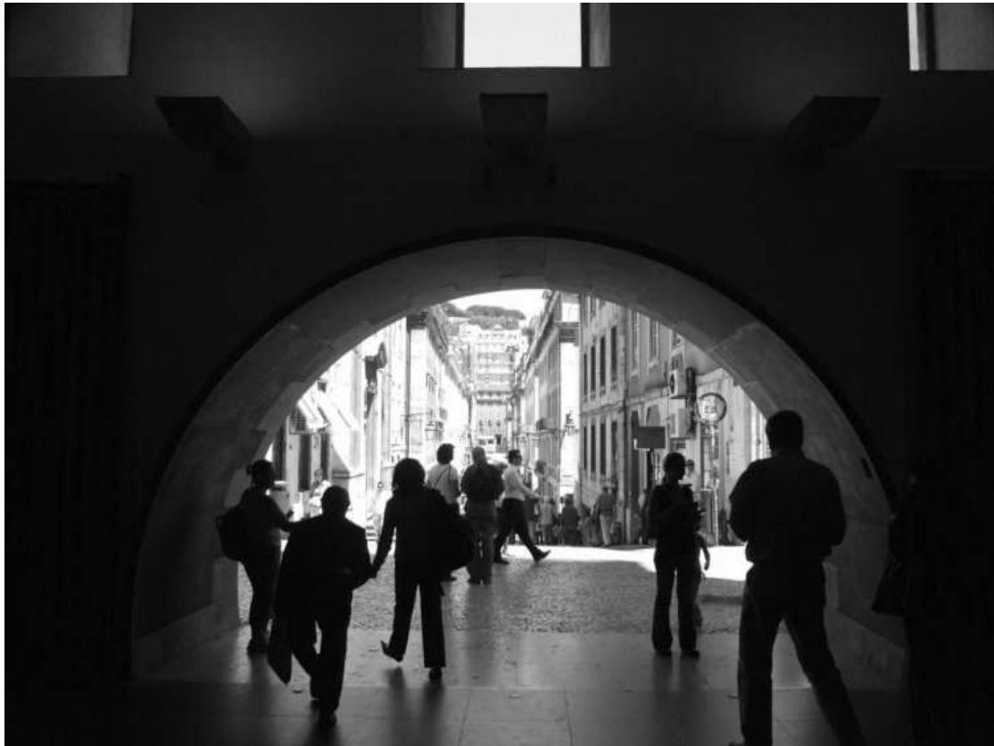
Imagem 1

Trabalho realizado por Sara Nunes Pires, N.º 18530, no âmbito dos seus estudos conducentes à obtenção do grau de Mestre em Arquitectura