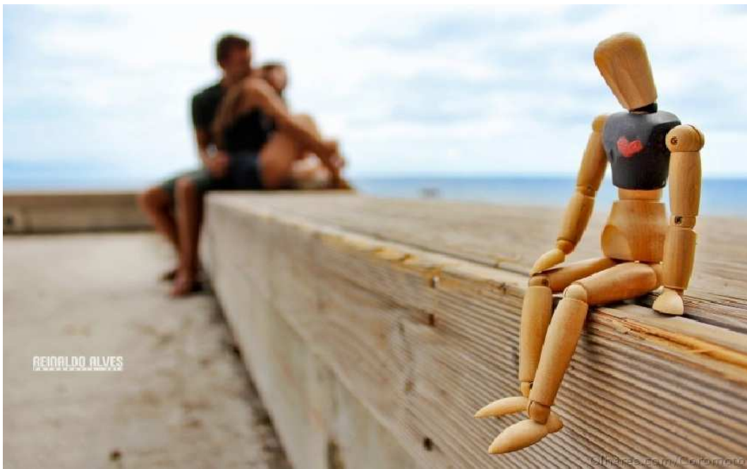
Imagem 3 Reinaldo Alves. Solidão .

(...)o espaço é um dos maiores dons com que a natureza dotou os homens e que por isso, eles têm o dever, na ordem moral, de organizar com harmonia, não esquecendo que mesmo na ordem prática, ele não pode ser delapidado, até porque o espaço que ao homem é dado organizar tem os seus limites físicos