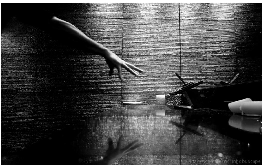
Imagem 2

O espaço é a própria experiência do Homem.