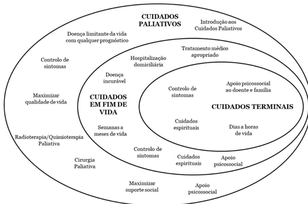
Figura 1 - Diferentes fases dos Cuidados Paliativos – Adaptado de Providence Health Care: “The Phases and Layers of Care” (7)

emocionais e espirituais, e estimulando a realização de tarefas que lhe proporcionem a melhor experiência de vida no tempo que lhe resta (6).