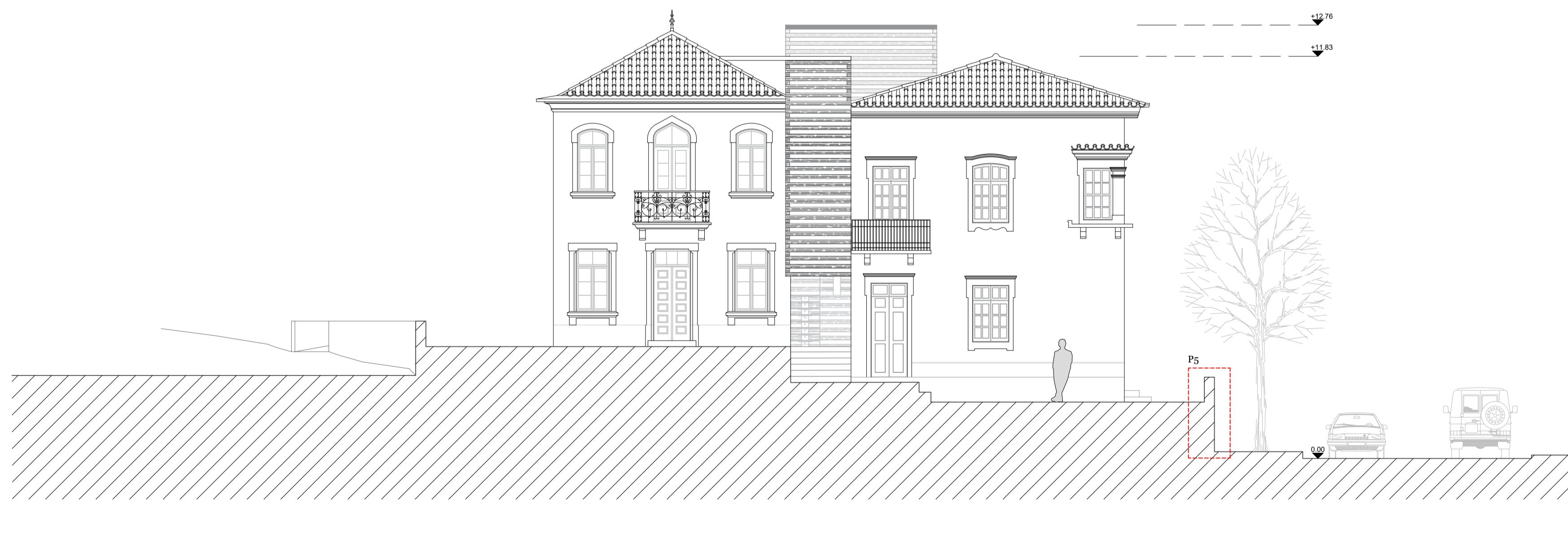
CORTE JJ' ESC: 1/100