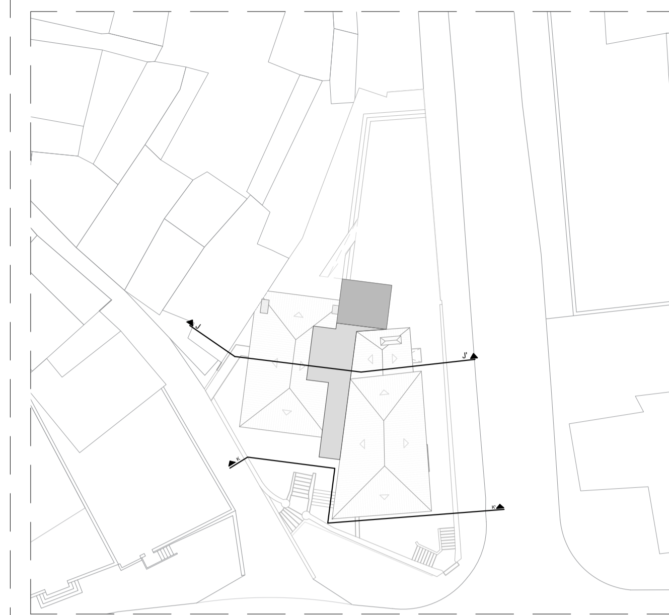
Ilustração 5 - Marcação de cortes