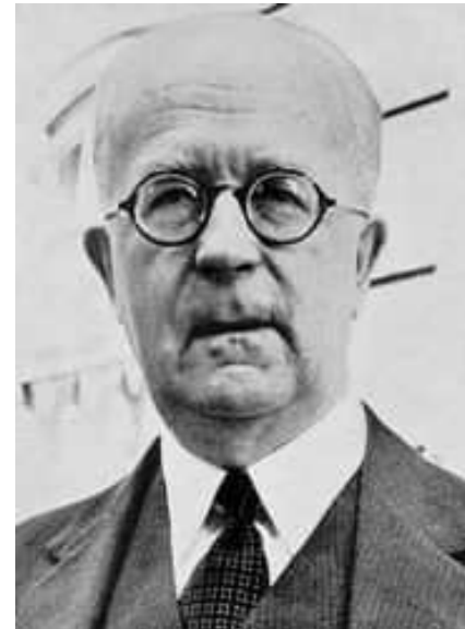
10 - Lord Cyril Radcliffe

Desempenhou entre outras funções o de Director Geral no Ministério da Informação e no final da guerra dedicou-se novamente à advocacia. Em 1949 passa para a Câmara dos Lordes e, em 1962, recebe o título de Visconde Radcliffe de Hampton Lucy. Era o homem de confiança de Calouste Gulbenkian, «he came into the Gulbenkian orbit when he was a young junior counsel and was called in to help to advise on one of the various facets of the Gulbenkian activities. 177 » É