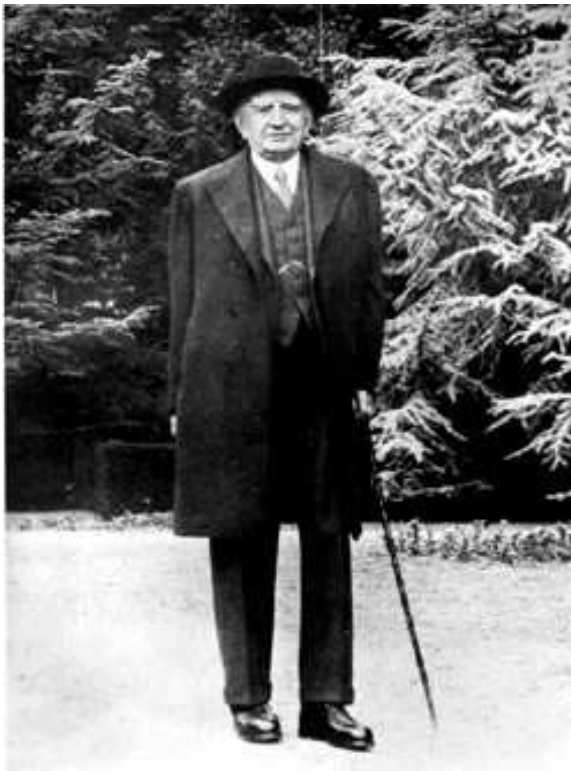
9- Calouste Sarkis Gulbenkian

Calouste Sarkis Gulbenkian nasce em 1869 em Uskudar. Desde criança que se demonstra muito estudioso e a família envia-o para Londres para completar os seus estudos na área de Engenharia Civil no King's College. Foi convidado para ser assistente de Lord Kelvin, um dos maiores cientistas do século XIX, contudo a família não permitiu. Como prenda de final de curso faz uma viagem de comboio a Baku. Começa a dar conselhos aos países para se interessarem pelo ouro negro do Cáucaso, depois de ver o desperdício que fazem em