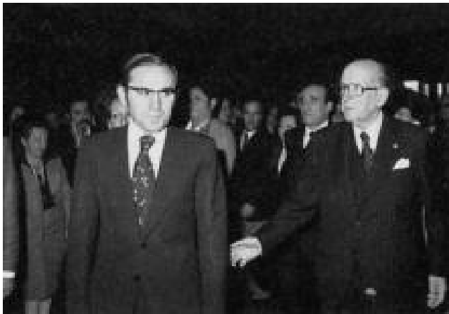
7- No dia 13 de Outubro de 1979, o Presidente da República General Ramalho Eanes inaugurava a exposição Macau - 400 Anos de Oriente.

só nos devemos interessar naquilo em que ela é diversa todos os dias. O dia de ontem não é de hoje. Nem o de amanhã será o de hoje» 68 .