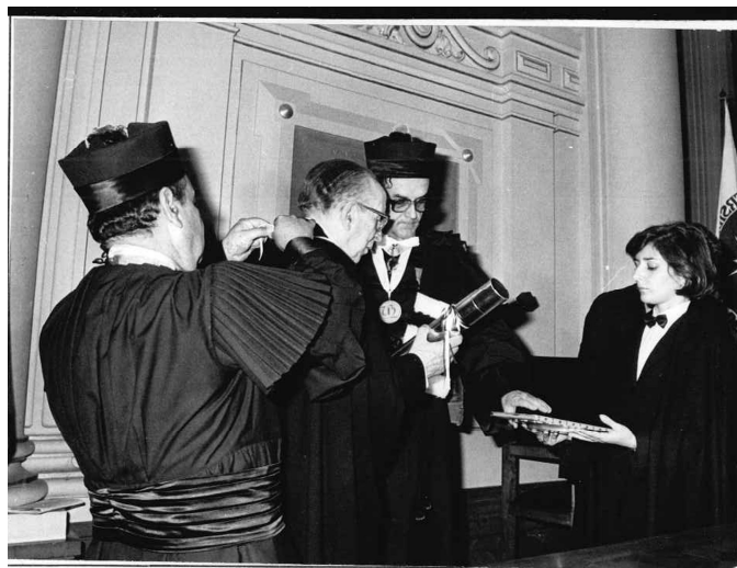
5- “Decano da Universidade Nova, impõe as insígnias do grau de “Doutor Honoris Causa” ao doutor Azeredo Perdigão, em reconhecimento do seu alto mérito científico, humanístico e académico.”

foi reparada a justiça, após a recepção do Doutoramento Honoris Causa , pela Universidade de Coimbra. 31