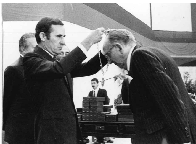
2- “Presidente da República, Ramalho Eanes, condecora o doutor Azeredo Perdigão no Dia de Portugal no Porto.”

Em Portugal e além fronteiras, proferiu palestras, homenagens, publicou e realizou inúmeras comunicações em conferências, ora sobre assuntos jurídicos, ora sobre matérias de carácter geral. Recebeu um extenso rol de distinções, tendo sido homenageado pelo trabalho que desenvolveu em toda a sua vivência em diversas áreas 22 .