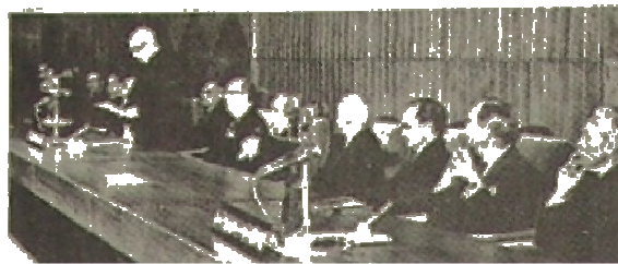
15 –“Américo Tomás discursando na sessão solene comemorativa da Inauguração da actual sede da Fundação Gulbenkian. Na frente, entre outros, Marcello Caetano, Azeredo Prdigão e Franco Nogueira.”

Situou-se no centro de Lisboa no Parque de Santa Gertrudes, a Palhavã. Foi inaugurada no ano de 1969.