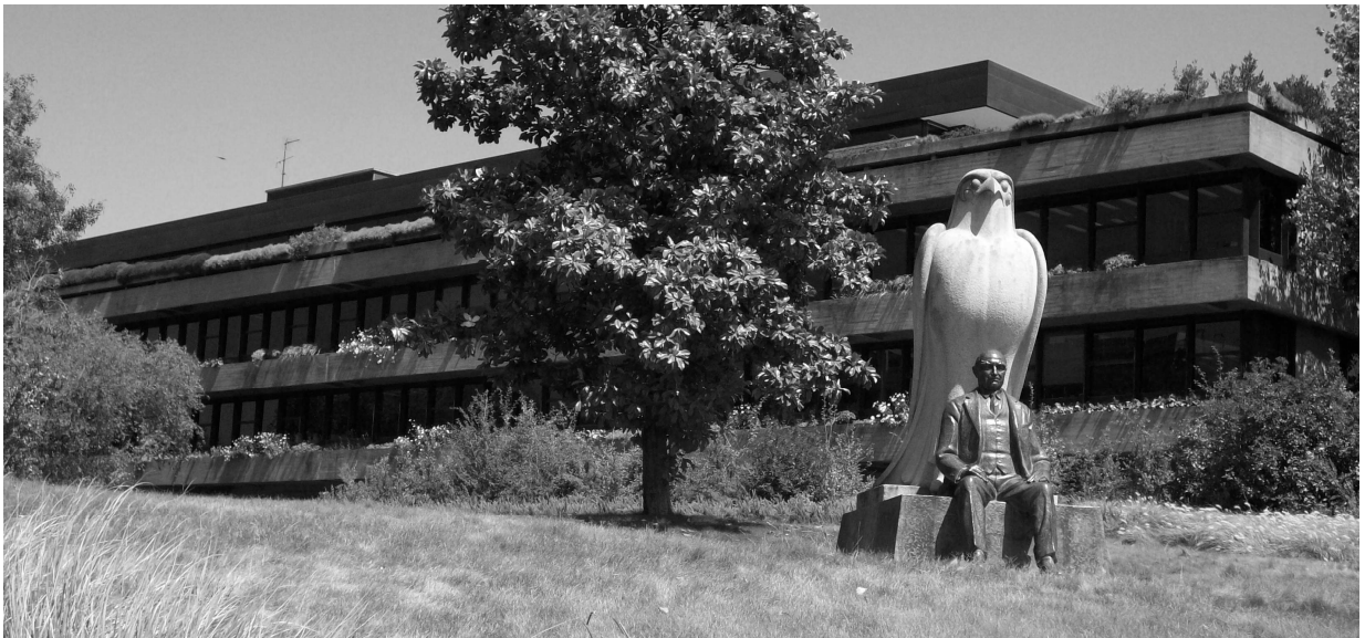
16- A Fundação Calouste Gulbenkian

«Na vida da Fundação há, realmente, dois períodos. O do antigo regime, em que a Fundação teve um papel de modernização, em muitas áreas supletivo do Estado, não apenas na cultura, mas por exemplo, na saúde e na ciência. Hoje, vejo a Fundação como uma função que não é tanto de suprir as falhas ou carências da acção do Estado, mas de ir mais além e ter um papel inovador e, na medida do possível, abrir caminhos» 304 .