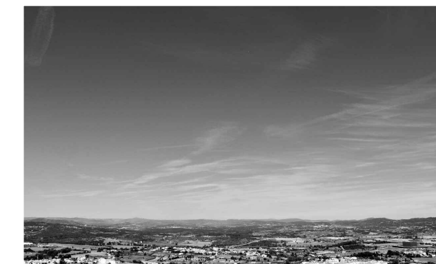
Img 1 - Vista aérea da Covilhã, 2018. Img 2 - Envolvente: Serra da Gardunha, 2018. Img 3 - Envolvente: Cova da Beira, 2018.