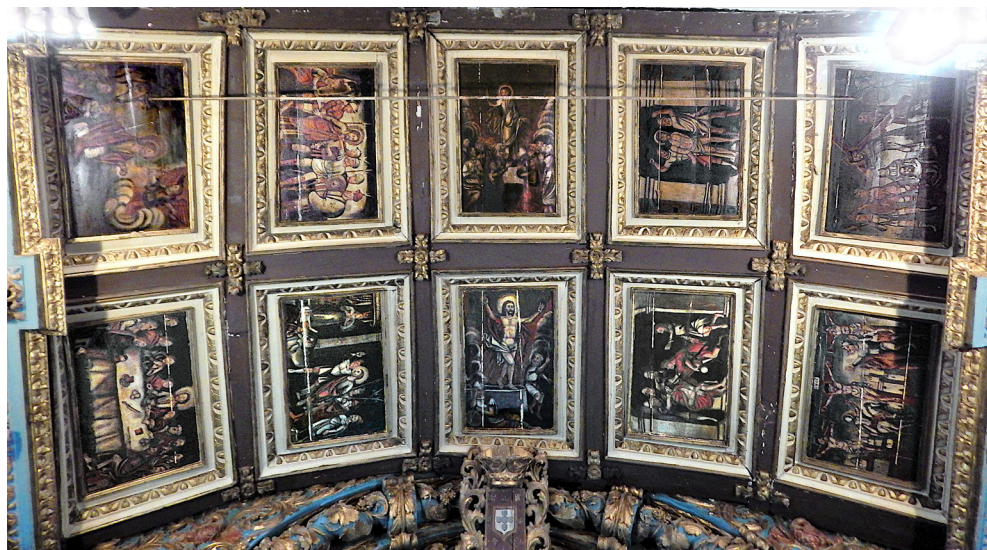
Fig. 2. Vista geral do tecto da capela-mor, segundo o esquema iconográfico. Igreja da Misericórdia, São Vicente da Beira, 2014

Na totalidade do discurso visual do tecto da capela-mor da Igreja da Misericórdia de São Vicente da Beira, cuja execução balizámos nos inícios do século XVIII, o (ainda) desconhecido pintor usou a mesma paleta cromática em todas as dez pinturas, e a técnica de óleo sobre madeira, com as cenas pautadas por um certo tenebrismo nos planos de fundo; esta técnica pictórica faz ressaltar os elementos representados no primeiro plano, centrando neles a nossa visão e atenção. Seguindo a linha de leitura traçada no esquema iconográfico acima apresentado, e analisando a fonte visual que apontamos para cada uma das dez pinturas, e que associamos à obra dos gravadores Wierix, é na transposição que se notam as maiores alterações formais — e este facto tem um propósito claro: converter as representações no mais reconhecíveis e verosímeis possível. Nestes moldes, e dado que as pinturas eram para figurar num tecto, também se verifica que se optou, na generalidade e comparativamente às fontes visuais, por uma simplificação, não apenas pela representação das cenas num só plano, mas também reduzindo-se o número de figuras.