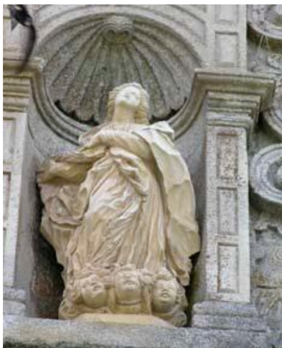
Fachada Oeste, entrada para a Igreja (AMTFM)

A construção do Mosteiro de Nossa Senhora da Assunção, de Tabosa, começou pela parte relacionada com o spiritus , a Igreja iniciou-