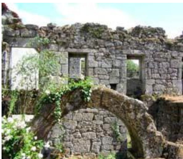
Dependências monásticas (AMTFM)

nicas adequadas de restauro e com a eleição correcta das funções apropriadas. (...) deve ser uma das primeiras considerações a ter em conta em todo o projecto regional e urbano.” Como refere Lacroix 11 : “(...) o património não pode esquecer que a sua verdadeira finalidade é o desenvolvimento da Pessoa. Para desempenhar eficazmente este papel, é importante que não seja museografado, congelado. Apenas poderá cumprir a sua vocação intelectual, afectiva, espiritual, se se aproxima do público, se se familiariza e se torna o suficientemente atraente”.