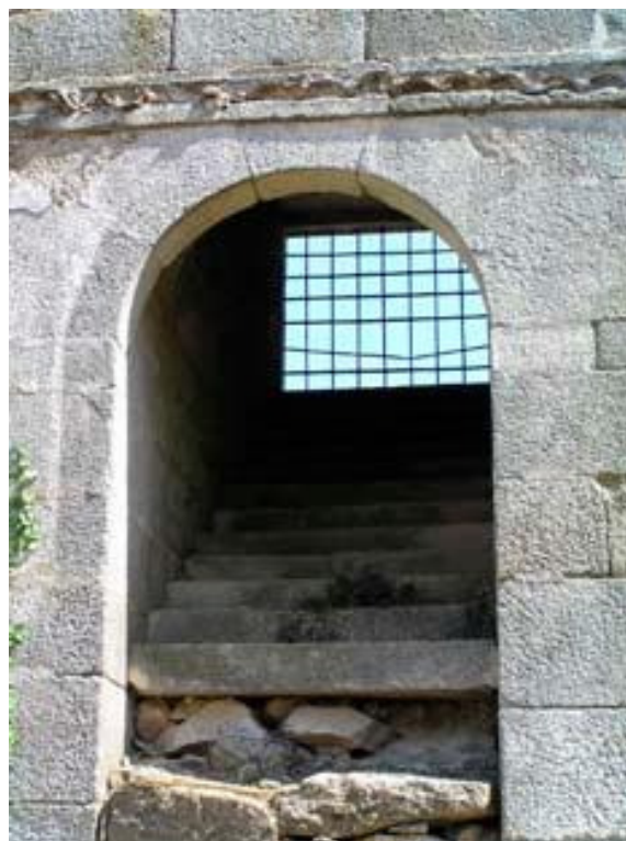
Acesso ao Mirante (AMTFM)