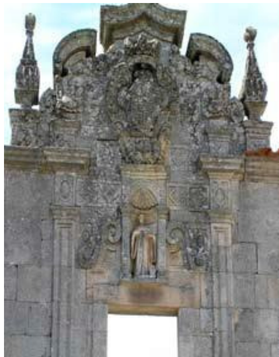
Fachada Sul, São Bernardo (AMTFM)

-se em 1685, antes da chegada das primeiras monjas, as quais chegaram a 10 de Setembro de 1692, vindas do Mosteiro de Nossa Senhora da Nazaré do Mocambo, em Lisboa. Até ao final do século XVII é construído o dormitório já com divisão em celas individuais. Eram onze