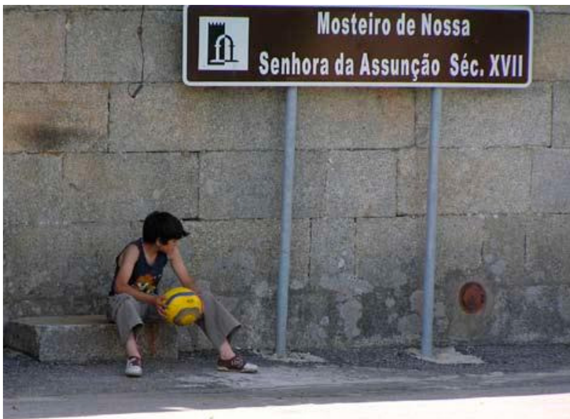
O Mosteiro de Tabosa, à espera de um futuro melhor (AMTFM)

Arquitecta. Docente da Escola Superior da Gallaecia