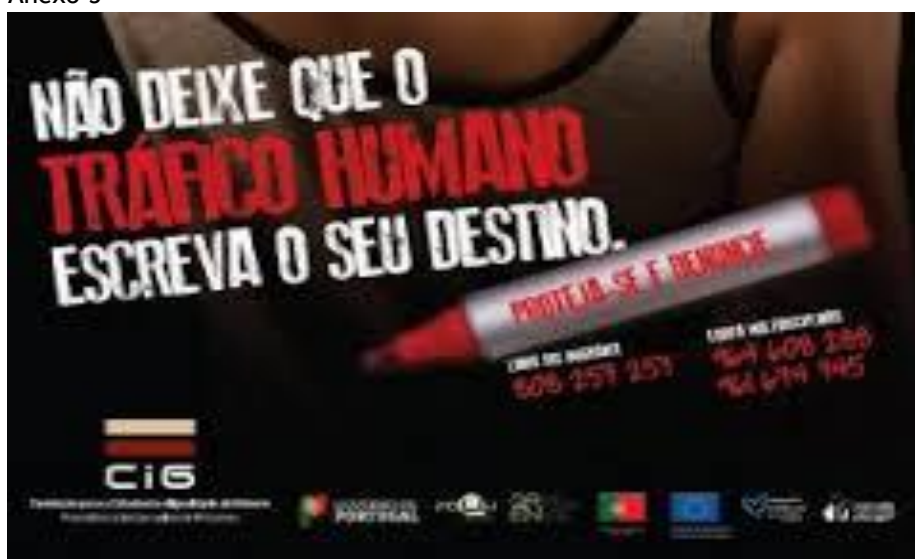
Figura 4 Campanha Não deixe que o tráfico escreva o teu destino