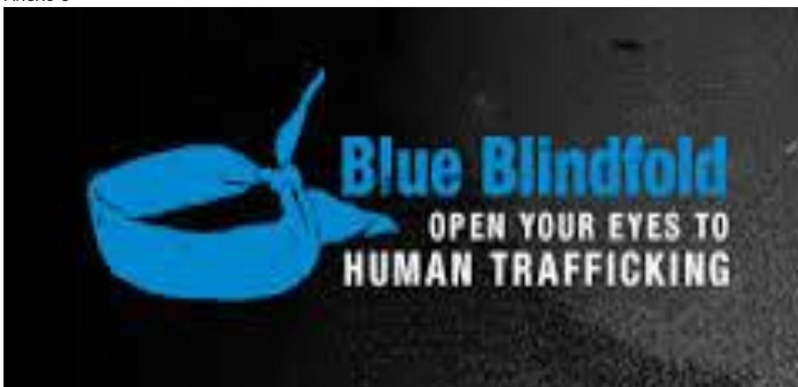
Figura 2 Campanha no Reino Unido