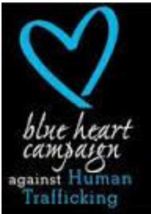
Figura 1 Campanha Coração Azul da ONU