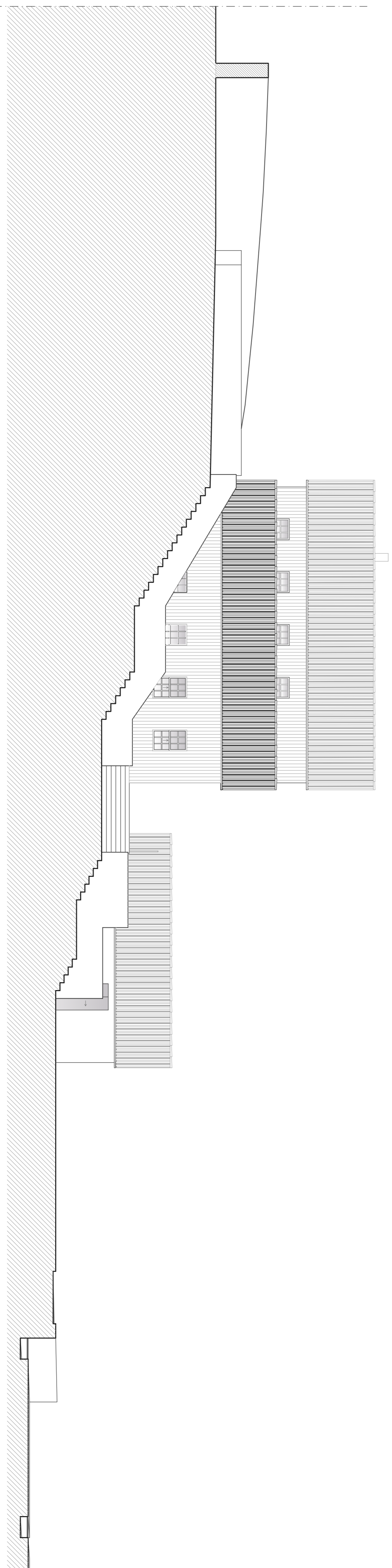
Secção transversal 2 1/100