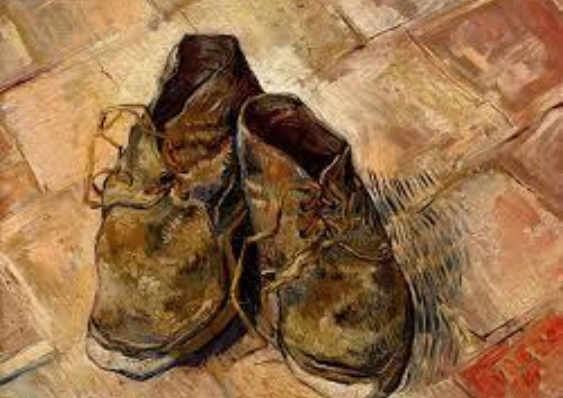
Van Gogh, Vicent