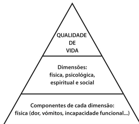
Figura 1. Representação da hierarquia da Qualidade de Vida (traduzido e adaptado de Cramer & Spikler, 1998)

Segundo a WHOQOL (1995, 1998; cit in Gaspar, Matos, Pais-Ribeiro e Gonçalves, 2008), a multidimensionalidade do conceito de qualidade de vida foi validada a partir de quatro dimensões: 1) dimensão física, que diz respeito à percepção que o sujeito tem da sua condição física; 2) dimensão psicológica, que se refere à percepção da sua condição afetiva e cognitiva; 3) dimensão social, associada à percepção que o sujeito tem das relações e papéis sociais que mantém; e 4) dimensão ambiente, que se refere ao ambiente em que o sujeito se insere. Cramer e Spikler (1998) conceptualizaram um modelo composto por três itens, distribuídos em forma de pirâmide. No topo a pirâmide encontra-se a qualidade de vida global dos sujeitos, também conhecido por “bem-estar geral”; no meio da pirâmide estão as dimensões da qualidade de vida no trabalho - física, psicológica, espiritual e social; e por fim, no nível mais inferior, encontram-se os componentes de cada dimensão (normalmente considerados como itens a integrar em instrumentos de avaliação) (Pimentel, 2006).