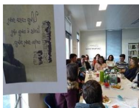
Figura 6 - Chá de livros

lanchavam e bebiam chá, comunicassem entre eles em português, espanhol, inglês e francês, consoante a língua estudada pelos alunos. Foi uma tarde bastante divertida e, na qual, os alunos se mostram interessados em participar.