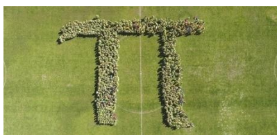
Figura 5 - O maior \pi humano

Os alunos estavam motivados e em grande alvoroço para a realização esta atividade. Apesar do calor e do tempo de espera, foi bastante agradável ver toda uma comunidade escolar empenhada para a conquista do novo record.