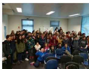
Figura 4 - Intercambio escolar

No geral, o balanço da atividade foi ótimo. Houve um feedback positivos de alunos e professores, com a promessa de em maio, os alunos portugueses irem a Badajoz.