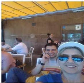
Figura 1 - Elementos do núcleo de estágio de português e espanhol