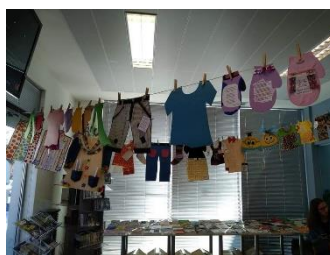
Figura 7- Estendal da roupa com poemas

No dia 19 de março, na biblioteca escolar, decorreu a atividade “estendal de roupa com poesia”. Esta atividade consistia em utilizar roupa que os alunos já não utilizassem e, nela colarem um poema escrito, à escolha dos mesmos. Por fim, utilizando um estendal improvisado, os alunos podiam estender as roupas com os seus poemas.