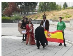
Figura 3 - Comemoração do dia da hispanidade