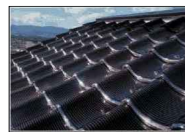
22 TELHAS - 16,2M 2