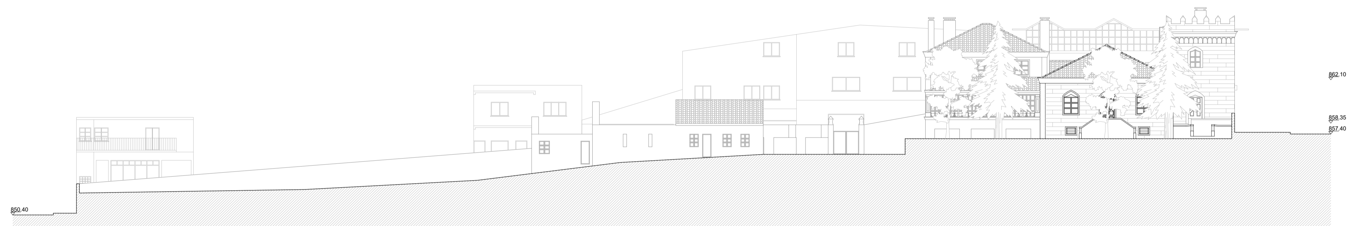
CORTE ALÇADO C_C