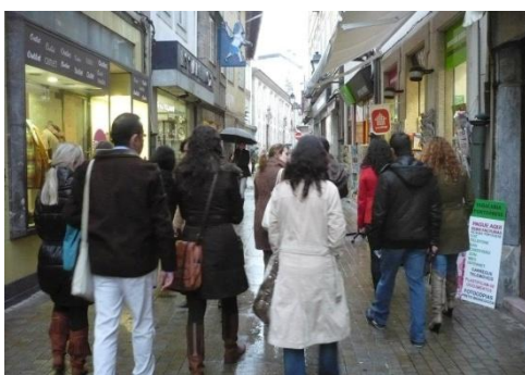
Figura 32: Visita a Viseu, projeto