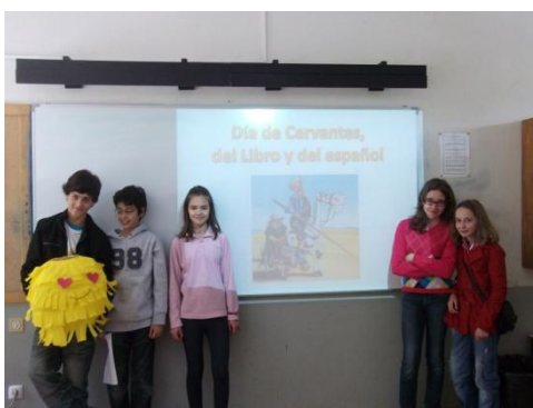
Figura 28: Conmemoración del día de Cervantes