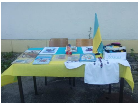
Figura 27: Comemoración del día de las lenguas extranjeras