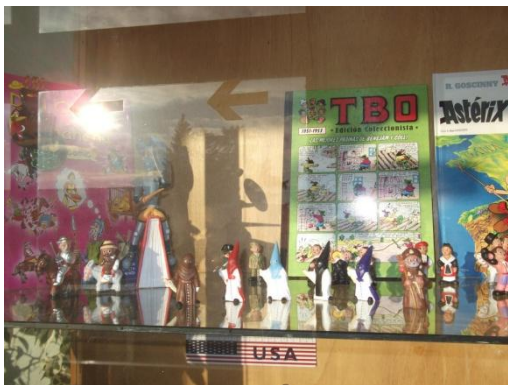
Figura 30: Comemoración de la semana Santa en España