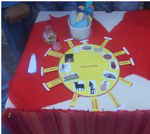
Figura 26: Conmemoración de la semana de las lenguas extranjeras