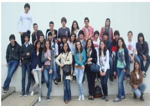
Figura 31: Visita de estudo a Lisboa