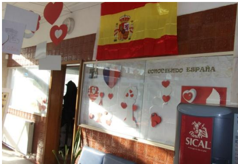
Figura 29: Conmemoración del día de San Valentín