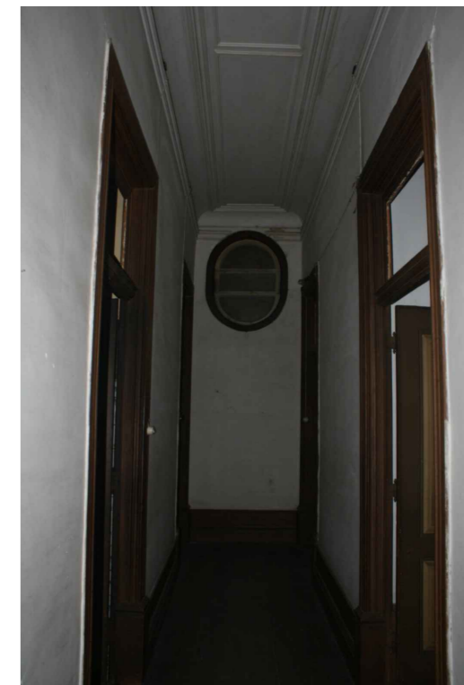
Corredor do Piso 2