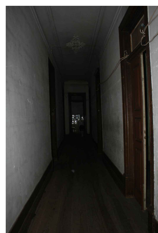
Corredor do Piso 1