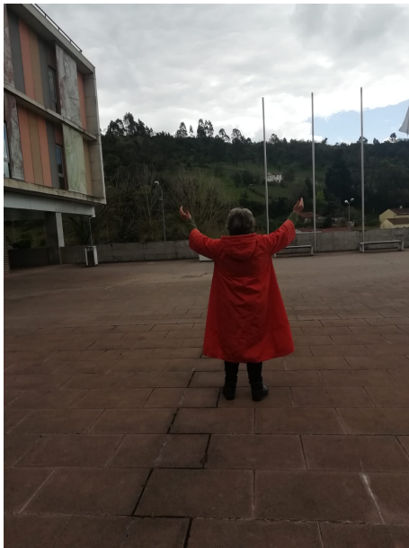
Figura 2. Fotografia participante P5: “(...) vou para a rua, isto é a minha libertação, preciso de estar a sós comigo e depois libertar-me (...)”

Os participantes associam a solidão a momentos de introspeção, silêncio, agradecimento e contemplação que promovem paz e clareza emocional, “ Tenho momentos de procura, de silêncio, de olhar para dentro de mim mesma, de conhecimento interior, momentos de prece e de agradecimento por tudo o que recebi na vida ” (P11).