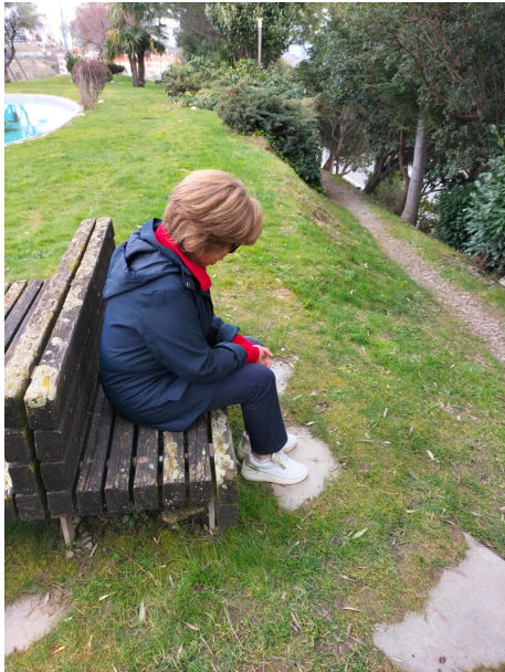
Figura 3. Fotografia participante P3: " (...) sentimento que há ali da ausência de tudo (...) ausência de uma palavra amiga, de um ombro onde se possa encostar, alguém que lhe diga alguma coisa e não se sinta tão abandonada (...) "