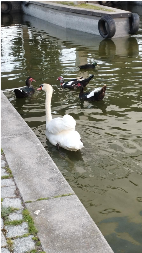
Figura 5. Fotografia participante P9: “ (...) eu não sei se o cisne estava mais sozinho, quando estava sozinho, ou se continua muito sozinho com aqueles patos todos à volta (...) o sentimento de solidão não se resolve estando no meio de muita gente (...)”

A Figura 5 foi utilizada como representação deste sentimento de falta de pertença.