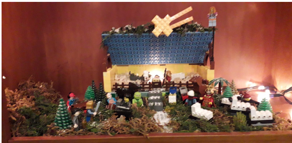
Figura 12. Fotografia participante P12: “Isto é um trabalho que fizemos em conjunto no Natal com os meus netos (...) foi um momento muito importante para nós.”

Na figura 12 é possível ver um trabalho manual realizado entre avós e netos que representou um “momento muito importante” (P12) para os avós.