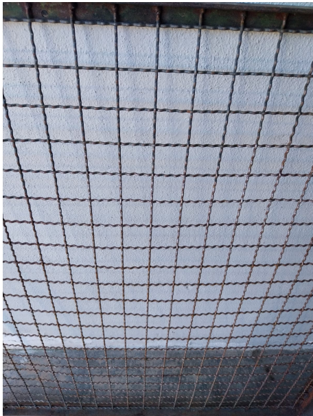
Figura 6. Fotografia participante P6: “(...) há solidão do lado de lá, atrás das grades (...)”

Os participantes mencionaram a falta de liberdade associada a situações em que a ausência de autonomia ou restrições impostas ao movimento e às escolhas pessoais levam ao isolamento emocional e à sensação de solidão. A restrição física foi exemplificada pela experiência de solidão vivida por pessoas em estabelecimentos prisionais, “(...) há solidão do lado de lá, atrás das grades (...) estamos a falar em cadeias.” (P6) (como representado pela Figura 6), já a privação de liberdade em contextos cotidianos foi exemplificada pela impossibilidade de sair de casa devido ao estado climatérico, “falta-me a liberdade que tanto gosto (...) quando eu não posso ir para onde eu quero, porque me impede a chuva e fico mais fechada.” (P11). Em ambas as situações, é provocada uma sensação de confinamento e solidão devido à limitação da capacidade do indivíduo de relacionar com outras pessoas.