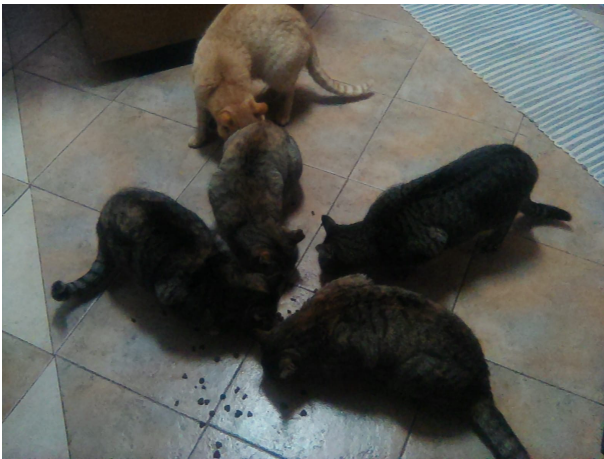
Figura 9. Fotografia participante P10: “(...) os animais dão-nos muito, são fiéis (...) são grandes amigos (...) retira muito a solidão.”

Na Figura 9 é possível ver um exemplo dos animais mencionados pelos participantes.