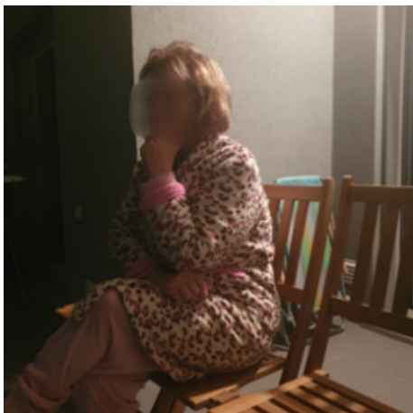
Figura 4. Fotografia participante P2: " (...) não quer sair da cama, querer estar metida na cama... não se arranja (...) "

Esta subcategoria descreve a ideia da solidão se manifestar através de um isolamento emocional e físico evitando, assim, o contacto com outras pessoas, " (...) é, nem querer ver, nem querer contactar (...) " (P9) e procurando refúgio em si mesmo, " (...) não querer sair, querer estar metida na cama... " (P2), como representado na Figura 4. Os participantes mencionam que este isolamento pode trazer consequências psicológicas, " (...) vamos fechando numa concha e somos tomados pela dor e pela tristeza (...) sentimentos que podem levar à perda de controlo (...) ou de desorientação na sua vida" (P4).