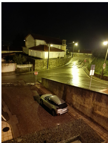
Figura 7. Fotografia participante P15: “(...) à noite ou durante a noite, por norma, a solidão bate mais forte, afeta-nos com maior intensidade (...)”

A Figura 7 é um exemplo das fotografias utilizadas para representar a solidão sentida durante o período noturno.