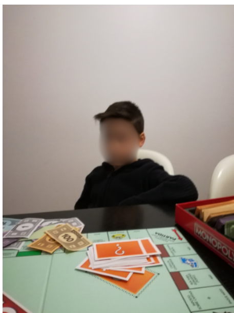
Figura 10. Fotografia participante P13: "(...) todas as vezes que estou com o meu neto, para mim é um rejuvenescimento."

Nota: Por questões de proteção dos direitos de imagem da criança, o seu rosto foi intencionalmente ocultado pela autora.