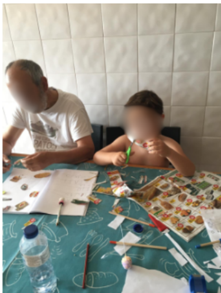
Figura 11. Fotografia participante P14: “(...) tem que fazer agora mesmo os trabalhos da escola. Se lhe mandam fazer a ele, o tio também tem que fazer.”

momentos de convivência construtiva, “os avós têm um papel muito importante, quando estão próximos, auxiliar os netos nas tarefas escolares” (P4); “é ainda mais se os ajudarem nos exercícios e tarefas escolares” (P10), como é possível ver na figura 11.