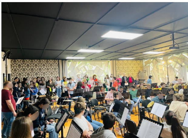
Figura 13. Fotografia participante P11: "É o encontro intergeracional da Banda da Covilhã, eu estou ali e estão também crianças e outros idosos."

Nota: Por questões de proteção dos direitos de imagem das pessoas na imagem, os seus rostos foram intencionalmente ocultados pela autora.