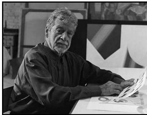
Imagem 9 - Fernando Lemos

Esta foi a transcrição mais difícil que fiz, mais uma vez era sem imagem, eu não conhecia o documentário nem o artista ou as suas obras. Houve certas partes em que era totalmente impossível decifrar o que era dito. O Fernando Lemos é um artista plástico luso-brasileiro, e a forma dele falar é uma espécie de mistura das duas línguas, o que acabava por tornar-se num dialecto estranho e desconhecido, pelo menos para mim, com palavras que eu nunca tinha ouvido. Creio que fossem expressões brasileiras, mas como não tinha imagem não consegui fazer associações, e era mesmo muito complicado decifrar. O documentário, como ainda está em fase de pós-produção tinha cerca de duas horas, era portanto demasiado extenso, o que não veio ajudar em nada.