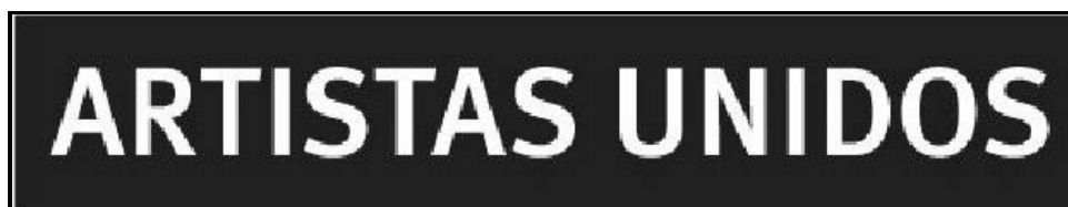
Imagem 1 - Logótipo dos Artistas Unidos

Artistas Unidos - Produção e Realização de Cinema, Teatro e Outros Espectáculos Artísticos, Lda., é uma sociedade por cotas fundada em 1996, pelo encenador e realizador Jorge Silva Melo, e está sediada em Lisboa.