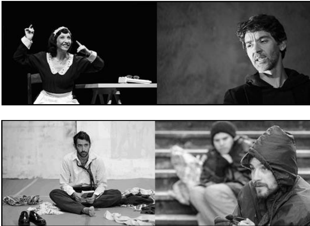
Imagem 3 - As peças A Fala da Criada (em cima à esquerda), Um Precipício no Mar (em cima à direita), Um Homem Falido (em baixo à esquerda) e Brilharetes (em baixo à direita)

Apesar destas duas vertentes, aquela em que os Artistas Unidos se focam mais e aquela em que conseguem ter mais trabalhos, é sem dúvida a área do teatro. Enquanto estive nos Artistas Unidos pude acompanhar várias peças como A Fala da Criada , Um Precipício no Mar , Um Homem Falido ou Brilharetes , peças essas que já estrearam em sala, e pude ainda trabalhar na pré-produção de outras quantas que irão estrear entre este ano e o próximo.