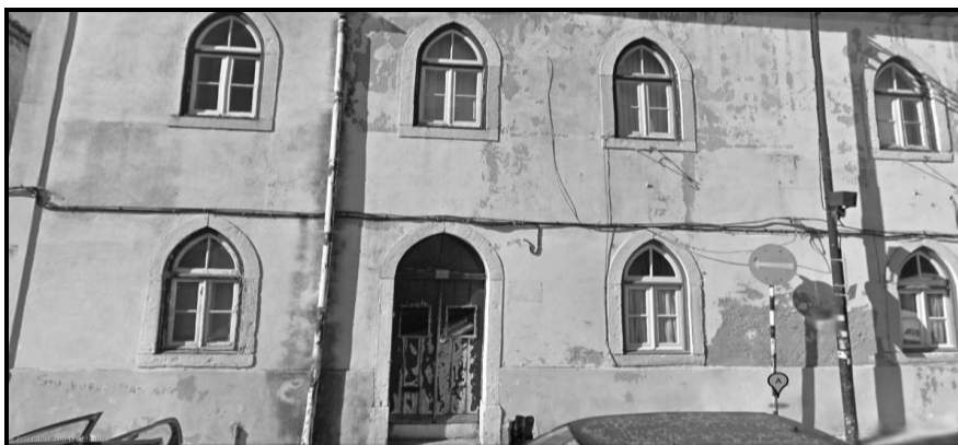
Imagem 5 - O escritório dos Artistas Unidos, em Lisboa

Para finalizar irei apontar um outro aspecto negativo, que não está propriamente associado ao funcionamento da empresa ou à forma como se trabalha, mas que tem a ver com uma questão estética e de higiene. Os Artistas Unidos têm neste momento o seu escritório num prédio velho e um pouco degradado, e há uma enorme falta de higiene, não só no edifício em si, como em tudo aquilo em que se toca, está tudo cheio de pó e lixo, sejam folhas velhas, dossiers, cartas, documentos importantes, tudo. A meu ver, esta falta de cuidado é um pouco derivada do descuido que existe e é mau para quando recebem lá pessoas novas, que não conhecem, e até mesmo para as que conhecem. Eu falo por mim, quando fui à entrevista fiquei um pouco de pé atrás com esta questão, mas não estou a dizer que os outros sítios são igualmente assim, ou que os Artistas Unidos sempre funcionaram desta forma, simplesmente acho que é uma questão que eu teria em consideração, no sítio onde trabalhasse.