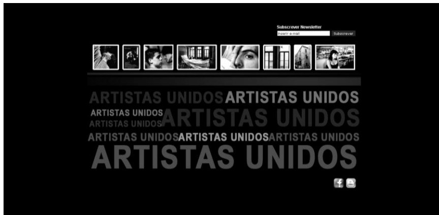
Imagem 2 - Website dos Artistas Unidos