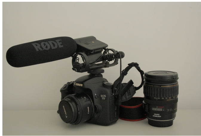
Fig. 5 -Canon 7D, Microfone Rode, objectivas 50mm e 28-135mm

O equipamento de registo externo possibilita a utilização de vários tipos de microfones profissionais de acordo com as necessidades.