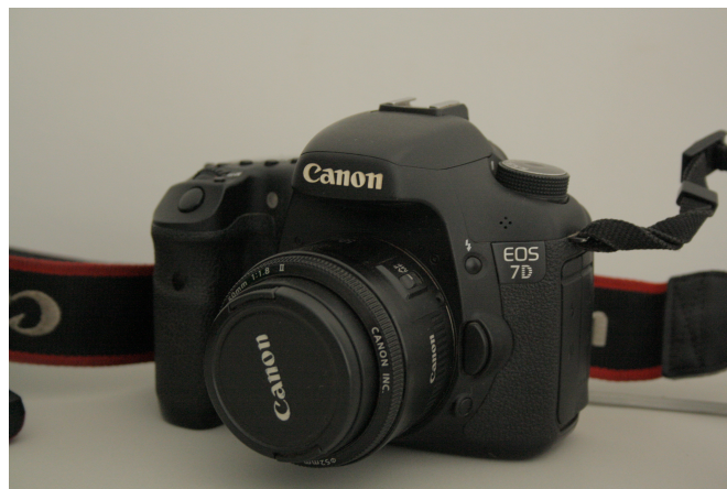
Fig. 3 – Canon 7D utilizada no período do estágio

A internet foi um aliado neste período, pois quando surgiam dúvidas procurava obter soluções, porque existe uma limitação de informação e saber na área do audiovisual e cinema em Cabo Verde. Já contando com isso adquiri alguns manuais que me orientaram durante este período.