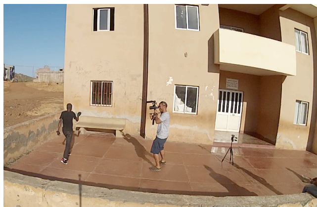
Fig. 8 - Rodagem do programa KASETADA

Este projeto foi bastante enriquecedor pelo facto de ter tido a oportunidade de conhecer pessoas ligadas às artes. Tive a chance de estar em contacto com os jovens e assistir às suas performance, constatei que os projetos deles têm um carácter social bastante forte.