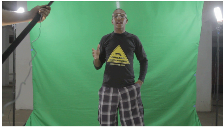
Fig. 7 - Filmagem do Komedu Show em Green Screen