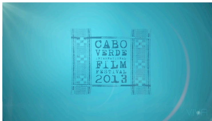
Fig. 2 - Background do spot para CVIFF

Para além destes cargos assumi outros aspectos básicos e essenciais para o bom funcionamento e desenvolvimento da empresa, como na gestão de material, contactos com possíveis participantes e sua confirmação para a participação no programa Kasetada.