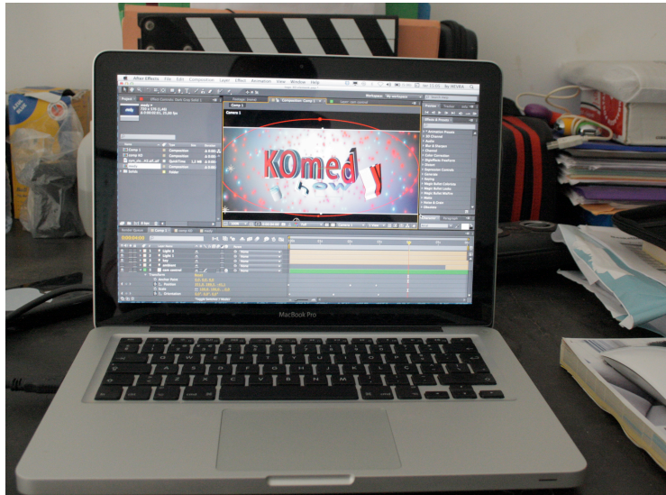
Fig. 9 -Efeitos Visuais do Komed y Show desenvolvido por mim