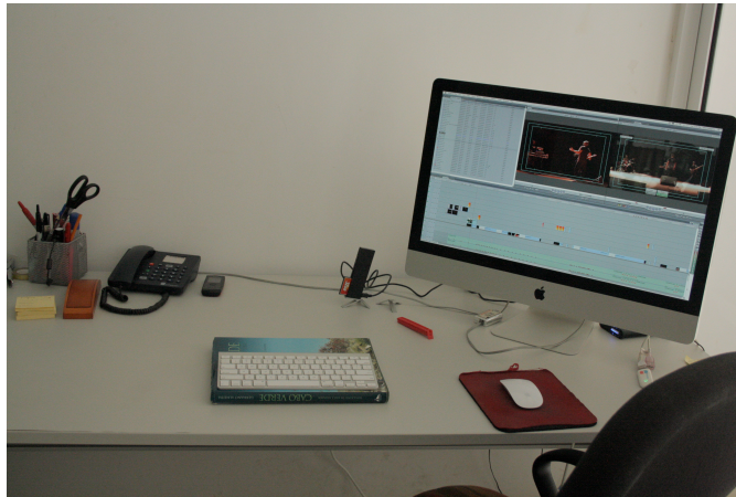
Fig. 4- Macintosh utilizado para edição e tratamento na VIVA Imagens

O Final Cut, mesmo sendo um programa novo para mim, não me ofereceu dificuldades de adaptação técnica. A experiência que adquiri com o Adobe Premiere, durante o percurso acadêmico, foi bastante útil nesse processo de adaptação, mas observei que o programa é mais prático.