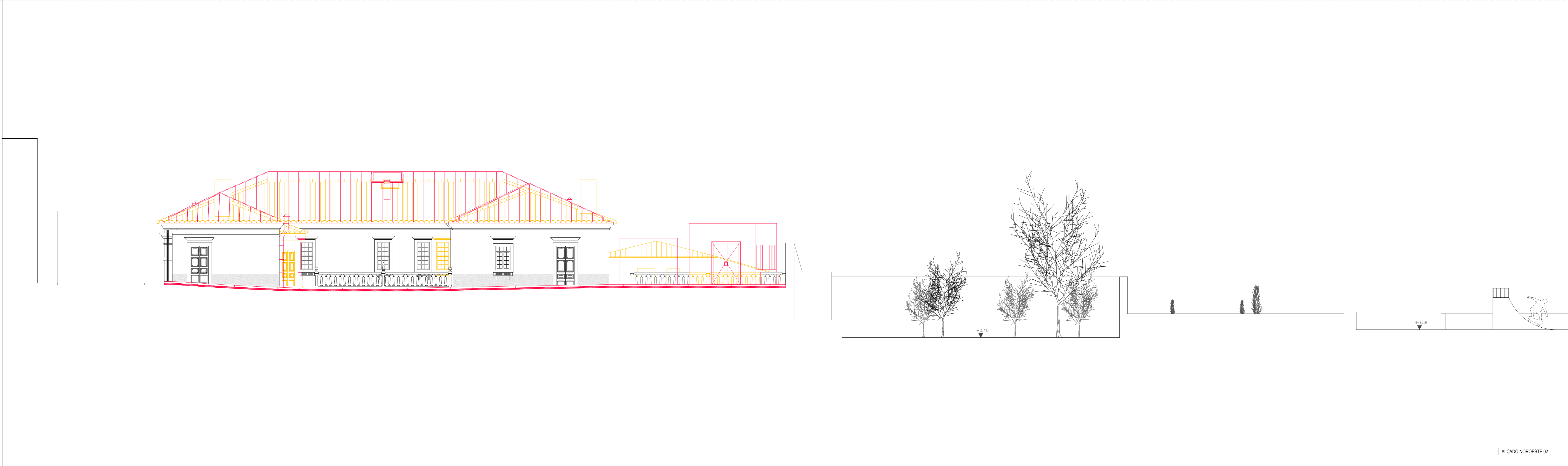
ALÇADO NOROESTE 02

LEGENDA TRAMAS A MANTER A CONSTRUIR A DEMOLIR