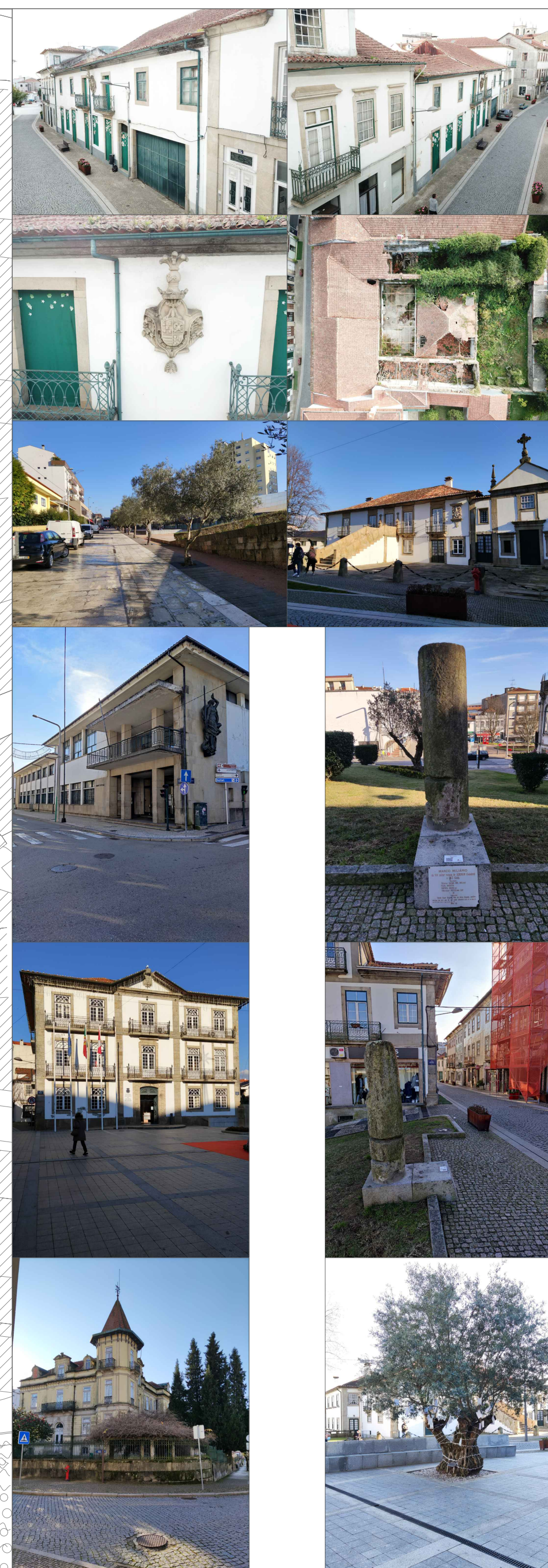
Fotografias do lote e dos edifícios de destaque na envolvente

O Lote a ser trabalhado, situa-se na zona histórica da cidade, na antiga rua romana (principal) da mesma. O edificado encontra-se em elevado estado de degradação como muitos outros ao longo da cidade e deste eixo pedonal tão icónico.