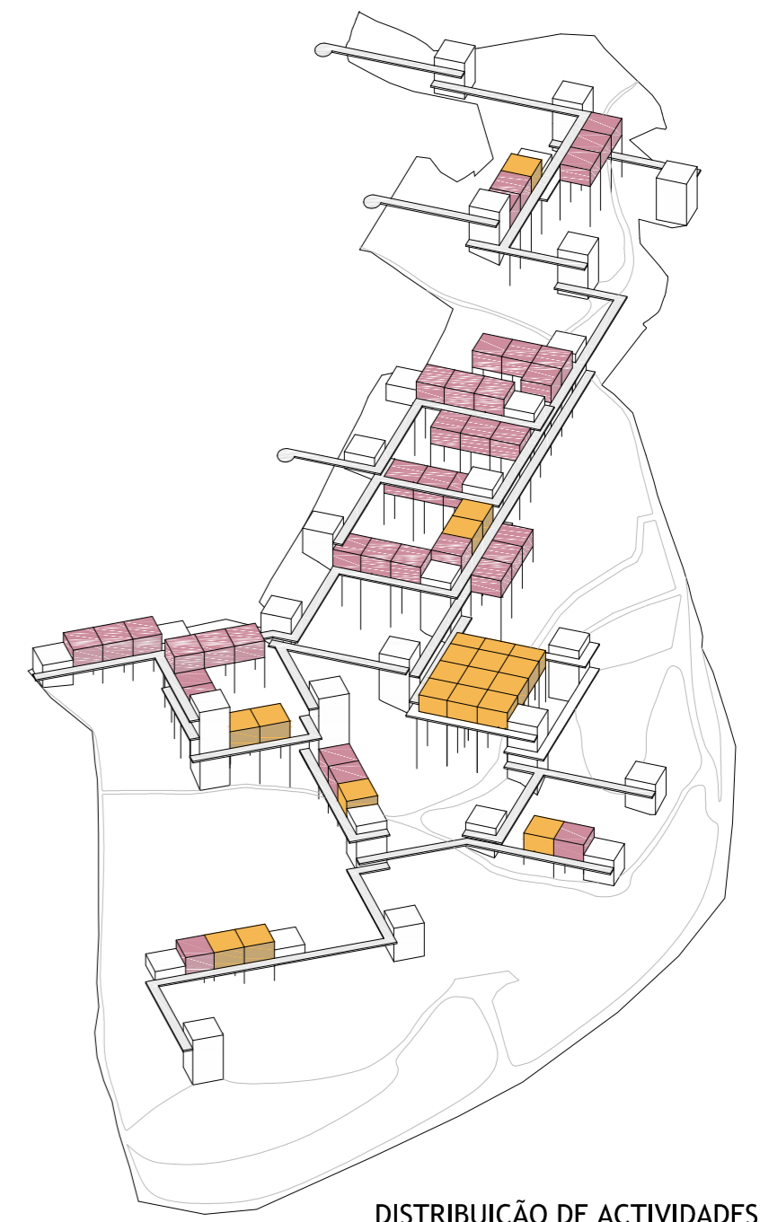
DISTRIBUIÇÃO DE ACTIVIDADES. ■ blocos para equipamentos. ■ blocos para habitação.