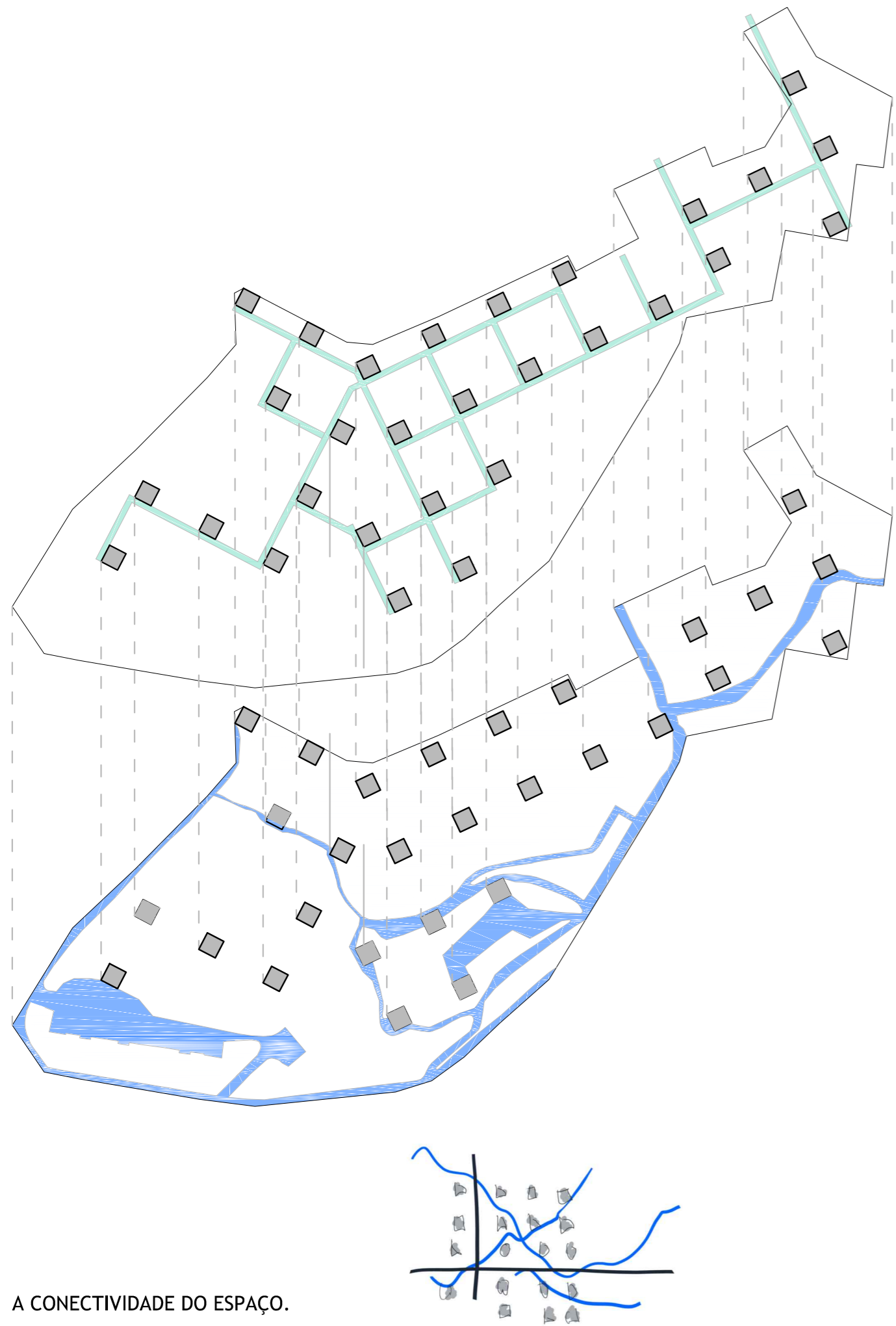
A CONECTIVIDADE DO ESPAÇO.

No esquema acima apresentado percebe-se que ao aplicar a métrica no espaço e, seguidamente, da grelha estrutural e da circulação desenvolve-se uma tensão entre a circulação determinada e a existente que promove uma nova dimensão no espaço, tornando-o mais híbrido.