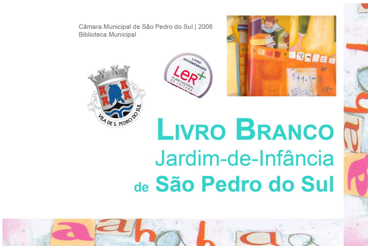
Figura 11 - Capa do “Livro Branco” proposto a todos os Jardins-de-Infância do concelho, que os preencheram tendo sido expostos na Feira do Livro, no final do ano lectivo