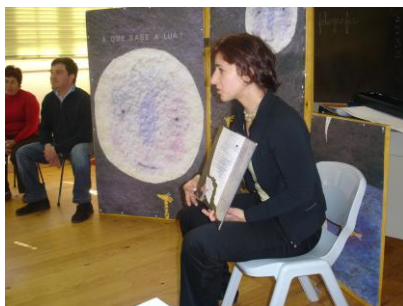
Figura 3 - Hora do Conto “A Que Sabe a Lua” na Biblioteca Municipal

Como é do conhecimento público no início do mês de Abril comemora-se o “Dia Internacional do Livro Infantil”, sendo que também a Biblioteca Municipal, preparou e apresentou o conto “A Que Sabe a Lua?” para as crianças do ATL da Misericórdia de São Pedro do Sul. Cerca de vinte e cinco crianças, mais as que se encontravam, no momento, na Biblioteca assistiram ao conto. No final proporcionou-se o diálogo com as crianças que entusiasticamente se divertiram com a história, que embora simples, é apelativa também devido ao cenário que elaboramos para o efeito.