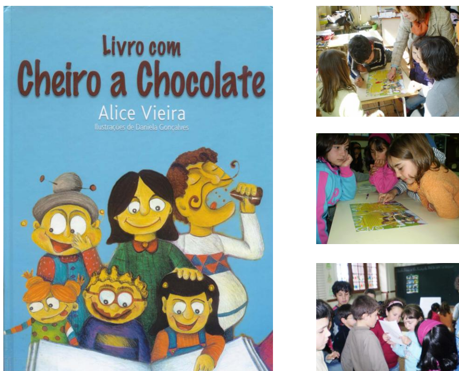
Figura 5 - Hora do Conto seguida de actividades desenvolvidas na Escola do 1ºCEB de Vila Maior

A Hora do Conto baseada na obra “Livro com Cheiro a Chocolate” consistiu no planeamento e implementação de actividades dedicadas aos quatro níveis de ensino visando a integração dos alunos e envolvendo a colaboração dos professores. Procurámos desta forma evoluir do simples modelo de apresentação do conto, acrescentando, a este, trabalhos mais dinâmicos e interactivos com os alunos e a colaboração dos respectivos professores, resultando num conjunto de acções muito bem-sucedidas.