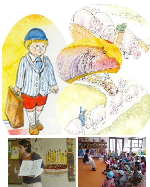
Figura 2 - Hora do Conto “O Rapaz dos Hipopótamos” no Jardim-de-Infância de Santa Cruz da Trapa

“Um hipopótamo seguiu um rapazinho da escola até casa: no dia seguinte havia dois hipopótamos; todos os dias chegavam mais hipopótamos. O pai procurou uma bruxa para dar ao rapaz um remédio anti-hipopótamos, mas...”