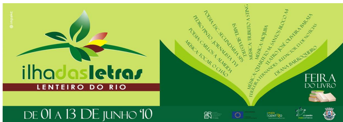
Figura 12 - Cartaz de divulgação da Feira do Livro em São Pedro do Sul