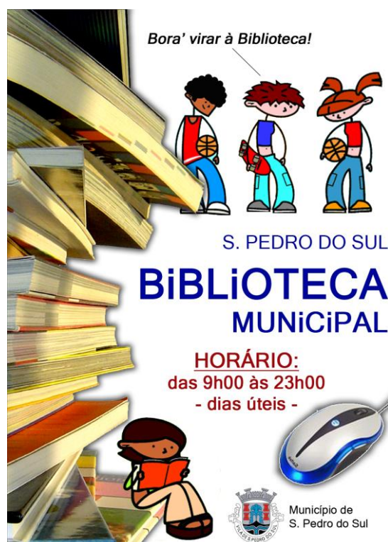
Figura 8 - Cartaz informativo sobre o alargamento do horário da Biblioteca Municipal, durante o Verão

Apresentamos alguns exemplos sobre a importância que a promoção do livro e da leitura constituem para o Município de São Pedro do Sul, a começar pelo horário alargado de funcionamento da Biblioteca durante os meses de Verão.