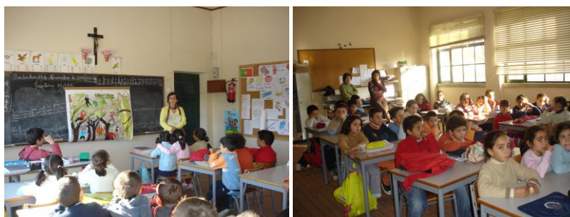
Figura 4 - Hora do Conto “O Gigante Egoísta” na Escola do 1º CEB de Bordonhos

A história o “Gigante Egoísta” de Óscar Wilde, percorreu as escolas do 1º Ciclo do concelho. De referir que, o fim do conto foi adaptado, sendo proposto no final aos alunos que lessem o livro e verificassem o final original da história. Louvamos a iniciativa de alguns professores que trabalharam o conto na sala de aula com os alunos, bem como outros que atribuíram, como trabalho de casa, recontar, por escrito, e eles próprios encontrarem um outro fim para a história.