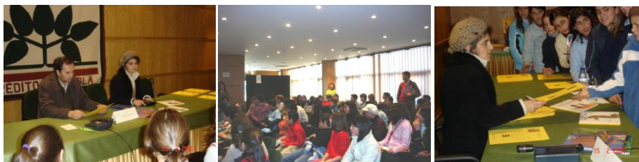
Figura 1 - Acção com a escritora Sara Monteiro e os alunos do 2º ciclo dos Agrupamentos de Escolas do Concelho

Passamos a referir alguns exemplos de práticas de leitura desenvolvidas pela Câmara Municipal de São Pedro do Sul, através da Biblioteca, em colaboração com os agrupamentos das escolas de São Pedro do Sul e Santa Cruz da Trapa, que aderiram às “Olimpíadas da Leitura”, promovidas pelo Instituto Português do Livro e das Bibliotecas . Trata-se de um concurso que permitiu aos alunos ler uma obra seleccionada, por concelho e falar sobre ela directamente com a escritora tendo que elaborar um trabalho individual segundo regulamento próprio.