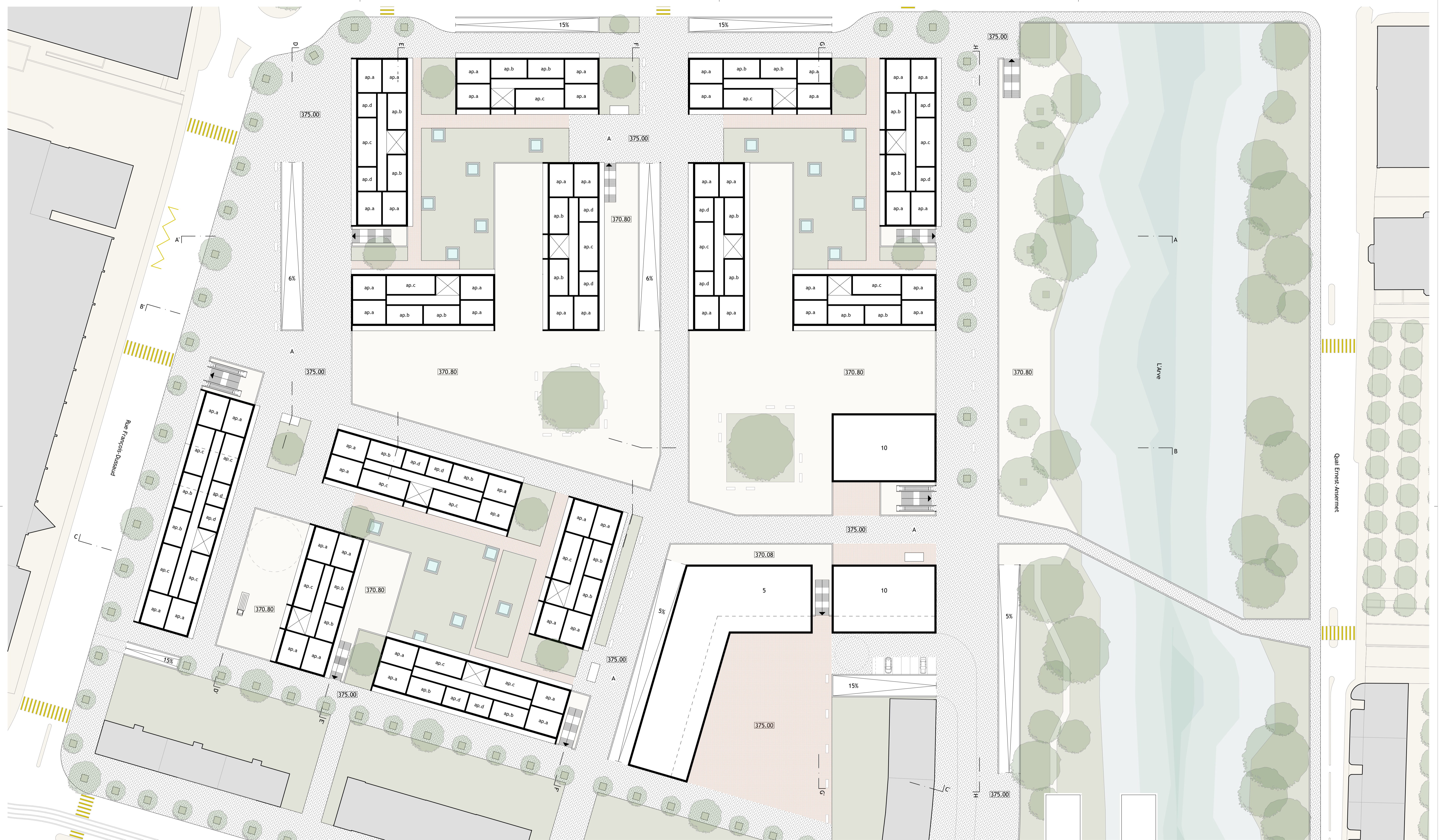
Piso 1 e pisos superiores 1/500