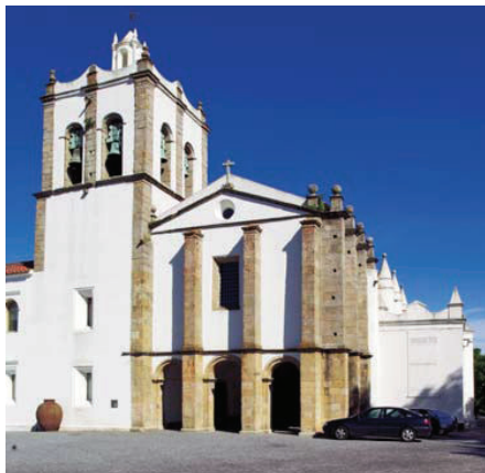
Convento de N. Sr.ª da Assunção, Arraiolos

de confrarias populares, à escrita da vida de santos, ao ensino às crianças dos primeiros elementos linguísticos e à assistência aos doentes e moribundos durante os surtos de peste. Colaboraram ainda, de forma activa, na direcção da reforma pré-tridentina portuguesa, através da visitação e reforma das Ordens de ƆCristo, ƆSão Bento, ƆCister e do clero da Diocese de Lisboa. Por Breve de Pio V, com data de 28 de Março de 1568, os Lóios foram também chamados a reformar os Cónegos de São Jorge de Alga, em Veneza, cujos Estatutos e modelo de organização tinham sido seguidos, na época da fundação, pela congregação portuguesa. Foi o coroar do empenhamento da Congregação dos Lóios na reforma do clero e a manifestação clara de um processo de institucionalização bem consolidado com mais resultados em Portugal do que em Itália. Depois desta intensa acção apostólica e caritativa, a partir do último quartel do séc. XVI entraram num processo de declínio. Perderam a protecção régia e tiveram de enfrentar a oposição das respectivas autoridades eclesiásticas, foram progressivamente abandonando a actividade assistencial nas prisões e nos hospitais, suspenderam o seu empenho missionário e a fundação de novas casas.