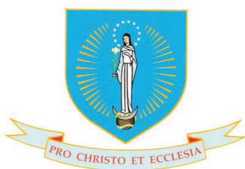
Logótipo dos Marianos (I)