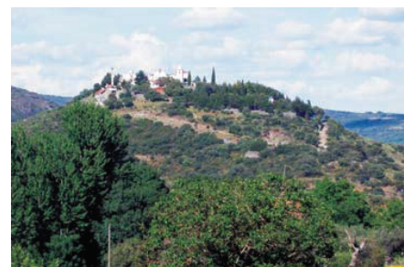
Panorâmica do Convento de Balsamão, a partir da estrada de Chacim para Balsamão (I)