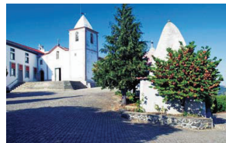
Igreja de N. Sr.ª de Balsamão (DB)