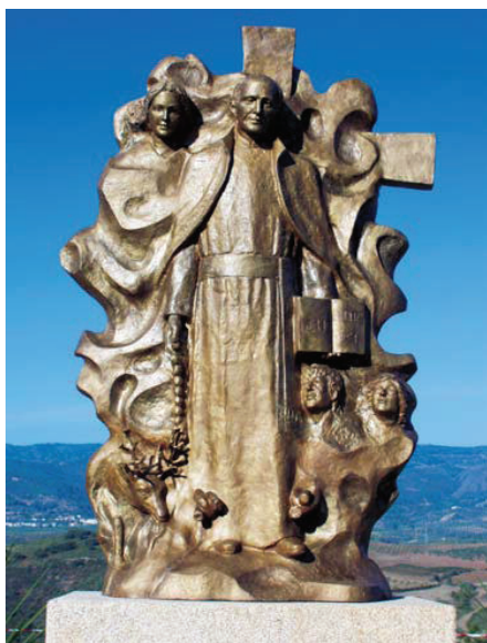
Monumento ao Beato Estanislaw Papczyński, Fundador dos Marianos, Balsamão (I)