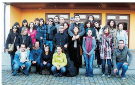
Retiro para jovens organizado pelos Marianos (I)

O seu carisma continua a ser o da fundação dos Marianos: defender o mistério da Imaculada Conceição – este é núcleo do seu carisma; rezar pelos irmãos defuntos e auxiliar os párocos na catequese do povo simples. Este último aspecto foi reforçado pelo Renovador da Ordem, Beato Jorge Matulaitis-Matulewicz, imprimindo-lhe um novo vigor eclesial, de abertura ecuménica, de intervenção activa