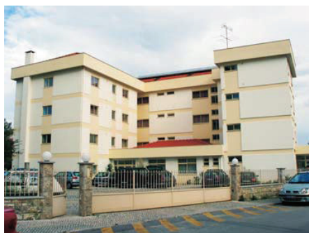
Seminário dos Marianos, Fátima (I)

Convento de Balsamão. Actualmente, 51 anos volvidos, os Marianos da Imaculada Conceição, em Portugal, estão constituídos como Vicariato da Província de S. mo Estanislau Kostka, dos Estados Unidos (com sede em Stockbridge, Massachusetts) e, além da Casa-Mãe em Balsamão, têm mais duas casas, em Fátima e em Lisboa.