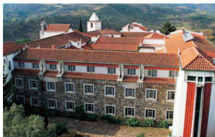
Convento de Balsamão e Casa de Retiros, vista geral (I)

longe. De reparador dos males que o seu irmão infligira à Congregação, tornara-se no grande impulsionador da expansão da Ordem desde a Lituânia, à Rússia e até terras do sol poente. Mas também o Brasil começava já a fasciná-lo. No seu diário, em Agosto de 1755, anota: “Pela graça de Deus, não me falta nada, mas, ao contrário, acima de mim mesmo, a maravilhosa Providência Divina, neste longínquo e desconhecido país, encontro maior desejo de servir a Congregação da Imaculada Conceição da Bem-Aventurada Virgem Maria. [...] O grande desejo de trabalhar tenho-o porque há esperanças para o desenvolvimento da Congregação. [...] Temos a esperança que esta Ordem, para honra