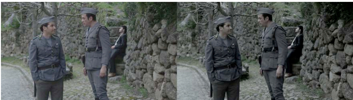
Figura 6 - Frame do filme com cor original (à esquerda). Figura 7 - Frame do filme com correcção de cor (à direita).

Além da habitual correcção de cor, que é elaborada nas produções cinematográficas, onde se corrige e se uniformiza a temperatura de cor e a luminosidade entre as diferentes cenas, idealizei também um look de cor para todo o projecto. O aspecto que tinha idealizado seria uma imagem a cores, mas em que a cor fosse quase totalmente de-saturada, a ideia era que existisse a presença da cor mas que esta não se destacasse, que se fundisse com a época em que o conto se passa e que de alguma maneira viesse a contribuir para um aumento da autenticidade tanto a nível cinematográfico como cénico e do guarda-roupa.