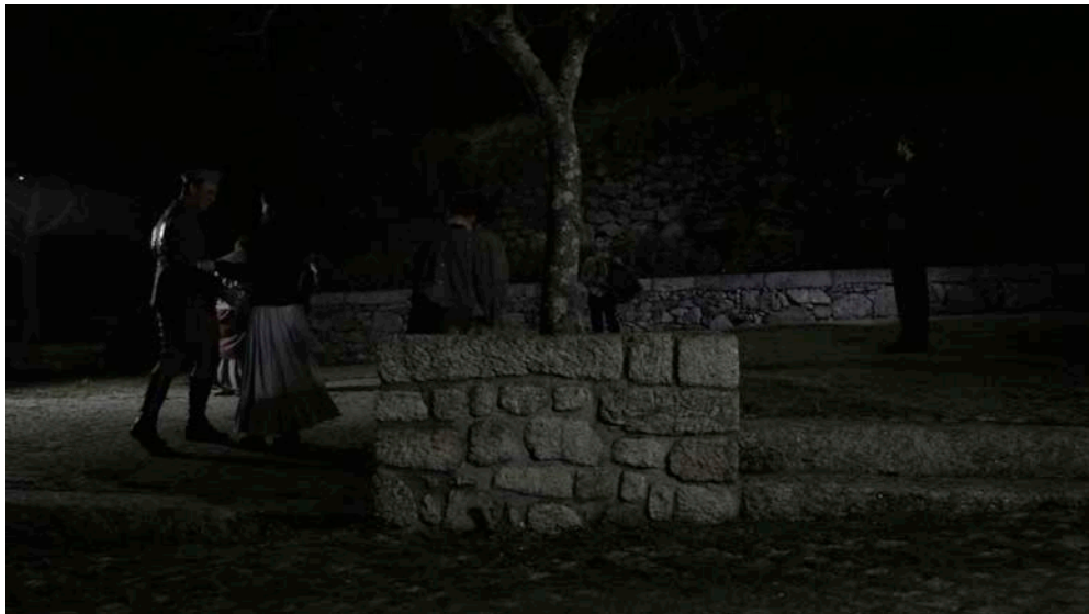
Figura 2 - Exemplo de simetria no enquadramento.