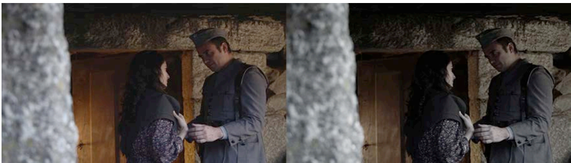
Figura 4 - Frame do filme com cor original (à esquerda). Figura 5 - Frame do filme com correcção de cor (à direita).

Durante os últimos anos tem-se verificado um aumento das produções cinematográficas produzidas a preto e branco e também um aumento do número de festivais em que o preto e branco é a temática principal ou uma das categorias, como referencias recentes posso citar o galardoado “The Artist” (Michel Hazanavicius, 2010), “Das weiße Band - Eine deutsche Kindergeschichte” (Michael Haneke, 2009) ou produção portuguesa “Tabu” (Miguel Gomes, 2012) ou até mesmo a co-produção da Universidade da Beira Interior “Vida Tramada” (Salvador Palma & Rui Rodrigues, 2012). Por este motivo a minha intenção inicial foi sempre distanciar-me desta tendência e não cair na tentação de gravar a preto e branco só porque era uma curta-metragem de época.