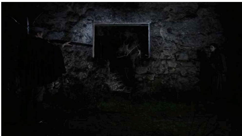
Figura 3 - Exemplo de simetria no enquadramento.