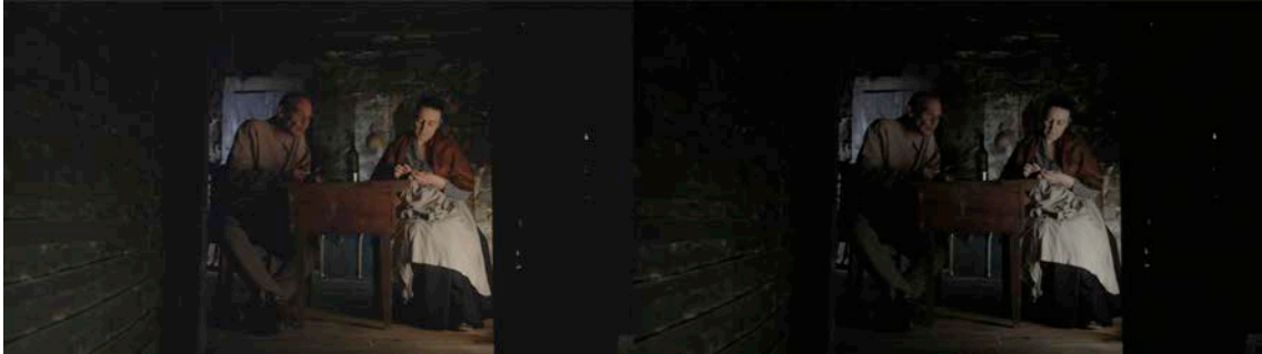
Figura 8 - Frame do filme com cor original (à esquerda). Figura 9 - Frame do filme com correcção de cor (à direita).

pretendia, ao observar lado a lado os mesmos planos com a cor original e a cor final, verificamos que esta procura por uma maior autenticidade foi conseguida, remetendo assim mais facilmente o espectador para uma determinada época.