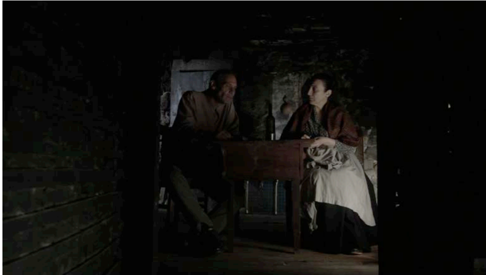
Figura 1 - Exemplo de simetria no enquadramento.