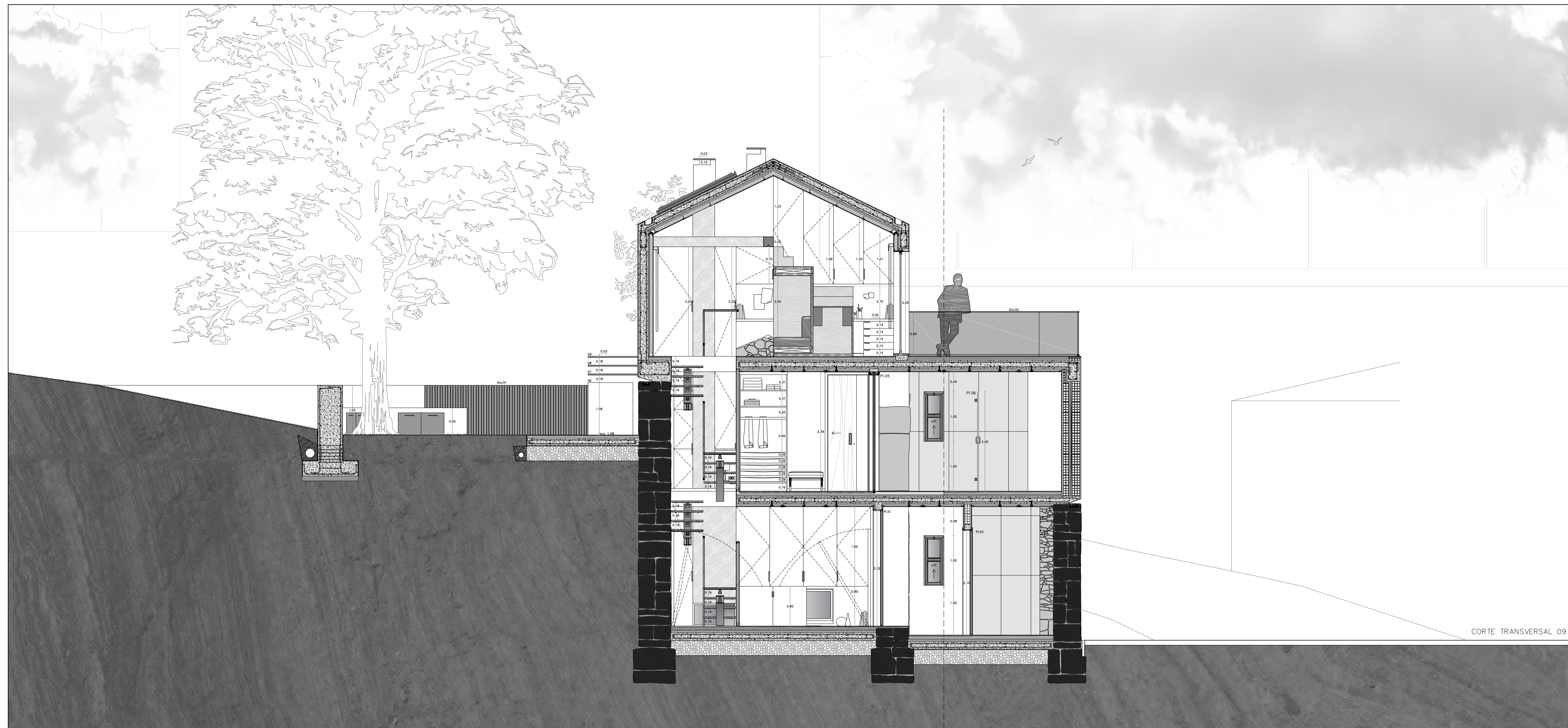
CORTE TRANSVERSAL 09