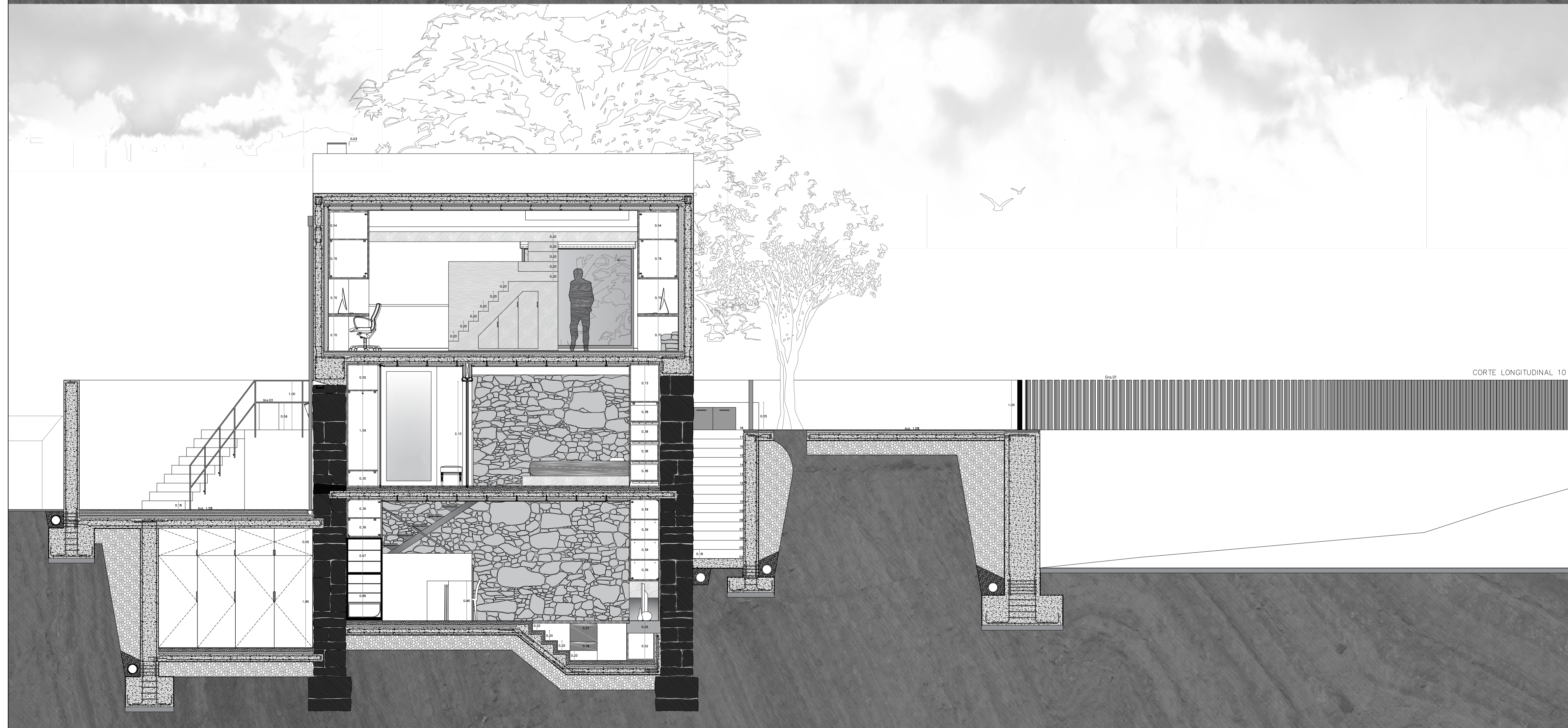
CORTE LONGITUDINAL 10