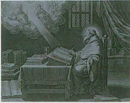
Agostinho em êxtase perante a Santíssima Trindade. Gravura de Bolswert. Bibliothèque Nationale de France.