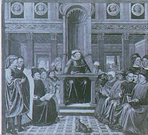
Agostinho ensinando em Roma. Fresco da igreja de Santo Agostinho em San Gimignano, Itália.