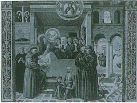
Êxtase em Óstia. Morte de Mônica. Regresso a Cartago. Fresco da igreja de S. Agostinho em San Gimignano.