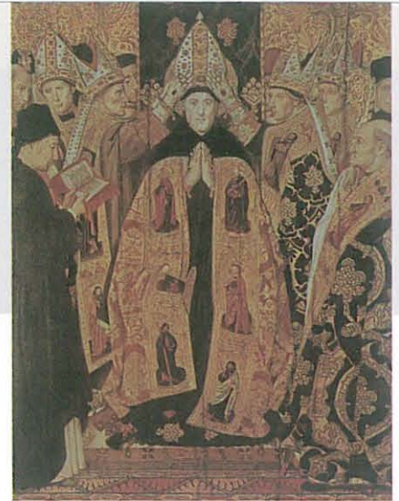
Retábulo representando a Sagração de Santo Agostinho. Museu de Arte da Catalunha, Barcelona, Espanha

Por isso, mergulha-se fazendo uma viagem de geometria variável, por regiões de complexa geografia psíquica, de que não temos carta antecipadamente, e onde se cruzam o passado, o presente e o futuro; lugares históricos, oníricos e escatológicos; a memória, a atenção e a expectativa; a imaginação, o desejo, a inteligência, a vontade; o sono, o sonho e a vigília; a crença, a razão e a fé; o mal, o pecado, o erro, a culpa, a ilusão e a desilusão; a procura, o encontro, a amizade, a alegria, o louvor: eis a coroa de rosas e espinhos de uma vida chupada até ao tutano. Esta é, pois, a experiência de um homem que, em toda a sua riqueza e complexidade, converge para as Confissões , e que releituras de todas as épocas concretizaram e universalizaram.