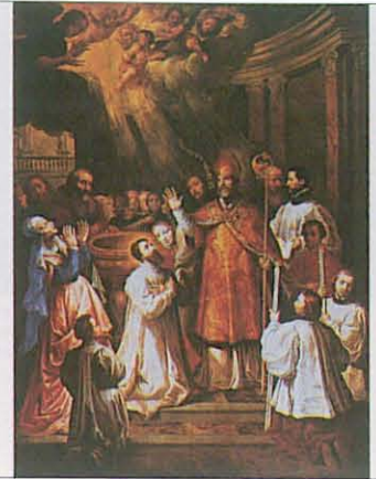
Batismo de Agostinho. Retábulo de Pepijn, Hospital de Santa Isabel, Antuérpia, Bélgica.

chama outro abismo no fragor das águas revoltas», as Confissões são o suspiro de um naufrago que veio à tona, trazendo consigo, das profundezas do oceano, um mar de experiências díspares, feitas de miséria e grandeza, de trevas e luz, de pecado e graça, de vício e virtude, de desespero e confiança. «Quem sou? Donde venho? Para onde vou?» São estas, no fundo, as questões essenciais do homem de todos os tempos e com as quais o filho de Mônica não podia deixar de se defrontar nesta obra. O acto de confessar, trazendo a existência à palavra, mobiliza energias latentes no humano que só assim vêm à luz e se tornam eficazes. Não basta a intenção de confessar: é preciso que existência encarne em Verbo, tornando-se presença actuante. A experiência que vem à linguagem ganha em Humanidade e esta realiza-se nesse acto, mas sem nunca nele se esgotar por inteiro. Por isso, e como o próprio nome sugere, as Confissões consubstanciam um acto linguístico que, na profunda convicção de Aurélio Agostinho, procura realizar aquilo que diz, especialmente nos momentos de louvor. Mas aquém e além da omnipresente retórica que as anima, qual belo embrulho de uma jóia preciosa, é preciso ir ao fundo da intenção que as fomenta, que é fazer a verdade diante de Deus e no meio dos homens.