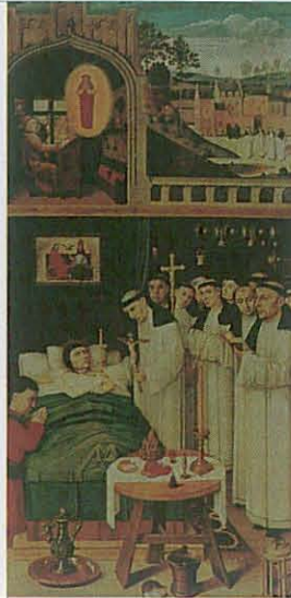
S. Jerónimo revela a Agostinho a glória celeste. Em baixo: morte de Agostinho. The National Gallery of Ireland, Dublin.

memória. E aí, no mais alto pináculo desta memória interior – apex mentis –, sobretudo aí, soube não se bastar a si mesmo. É então que a memória é iluminada na sua pobreza ontológica e, como faísca, dá-se o ressalto de consciência. Descobre enfim o que, ignotamente, sempre fora: um desejo ontológico de Deus, uma relação com a eternidade, uma memória metafísica, ontológica, onde ficou impressa a marca do Criador. «Tarde te amei, beleza tão antiga e tão nova, tarde te amei! E eis que estavas dentro de mim e eu fora, e aí te procurava, e eu, sem beleza, precipitava-me nessas coisas belas que tu fizeste. Tu estavas comigo e eu não estava contigo. Retinham-me longe de ti aquelas coisas que não seriam, se em ti não fossem. Chamaste, e clamaste, e rompestes a minha surdez; brilhaste, cintilaste, e afastaste a minha cegueira; exalaste o teu perfume, e eu respirei e suspiro por ti; saboreei-te, e tenho fome e sede; tocaste-me, e inflamei-me no desejo da tua paz.» ( Confissões , X, xxvii, 38).