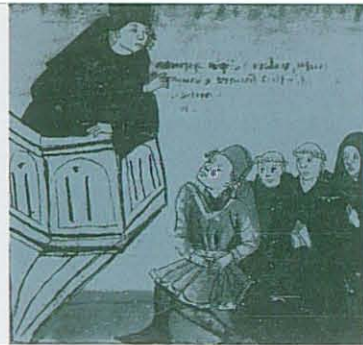
Já célebre, Agostinho prega em Hipona perante um leigo ricamente vestido e três frades. Manuscrito de Boston, séc. XV.

Momento decisivo é o da conversão. E aqui é preferível deixar falar o próprio Agostinho. «Quando, do mais íntimo recôndito da minha alma, uma profunda meditação arrancou e acumulou toda a minha miséria diante do olhar do meu coração, desencadeou-se uma enorme tempestade, que trazia uma enorme chuva de lágrimas. E, para que eu derramasse toda essa chuva de lágrimas, com os seus clamores, levantei-me de junto de Alípio – a solidão parecia-me mais propícia à aflição do choro – e afastei-me para mais longe, de modo a que a presença dele não constituísse para mim mais um peso. Era assim que eu estava, e ele percebeu-o, pois, julgo, eu tinha dito não sei o quê em que o som da minha voz já se mostrava carregado de choro, e assim me levantara. Ele ficou onde estávamos sentados, deveras perplexo. Eu deitei-me debaixo de uma figueira, não sei de que modo, e soltei as rédeas às lágrimas, e dos meus olhos brotaram rios, sacrifício digno de ser aceite por ti (...). Chorava com a contrição amaríssima do meu coração. E eis que ouço uma voz vinda da casa ao lado, com o canto de alguém, não sei se menino ou menina, que dizia e repetia muitas vezes: “Toma, lê, toma, lê”. E de imediato, com o semblante mudado, atentíssimo, comecei a pensar se as crianças costumavam cantar tais palavras em algum tipo de brincadeira, e não me ocorria de maneira alguma que o tivesse ouvido