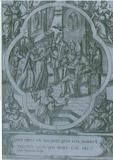
Ordenação de Agostinho. Gravura de Joannes Wandereisen.