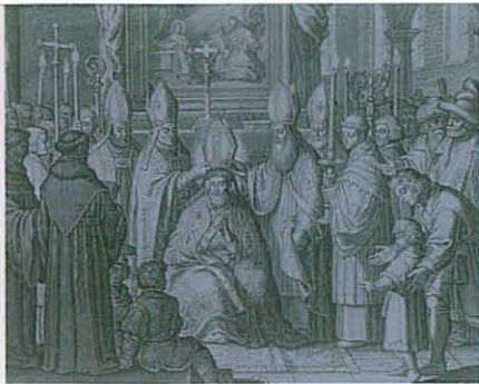
Outra representação da sagração de Santo Agostinho. Gravura de Bolswert. Bibliothèque Nationale de France.