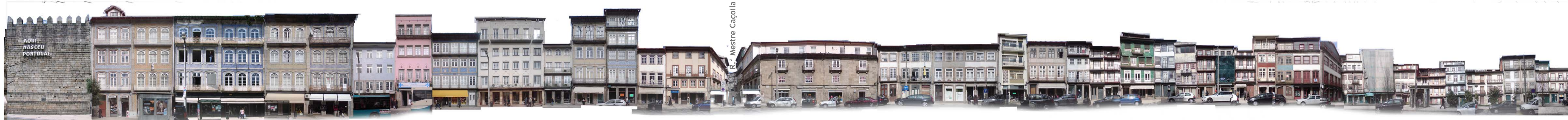
Alçado Alameda norte