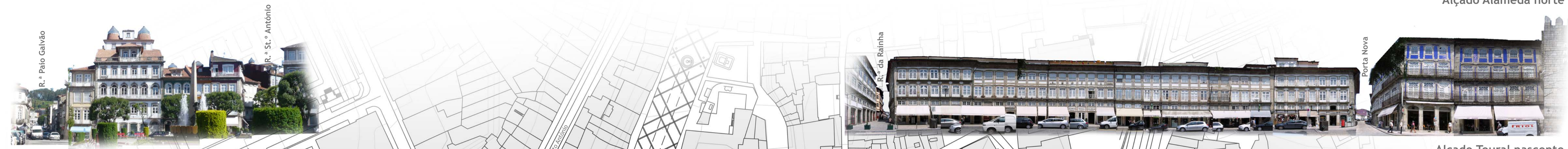
Alçado Toural nascente