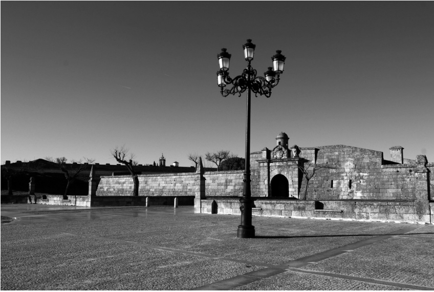
Figura 5 Entrada Poente do Forte de Almeida