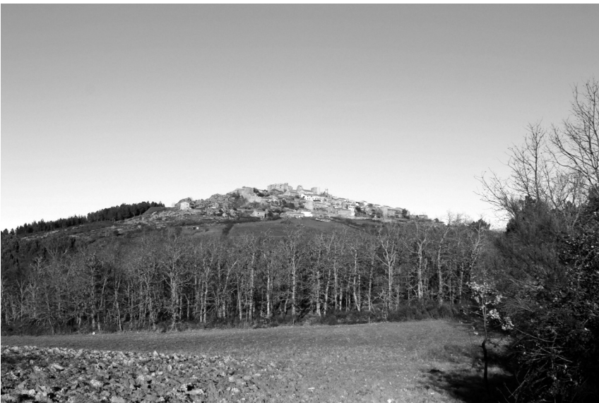
Figura 6 Vista panorâmica da Aldeia Histórica de Castelo Rodrigo