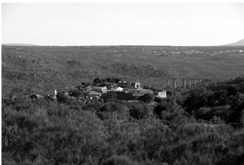
Figura 2 Vista panorâmica de Castelo Bom