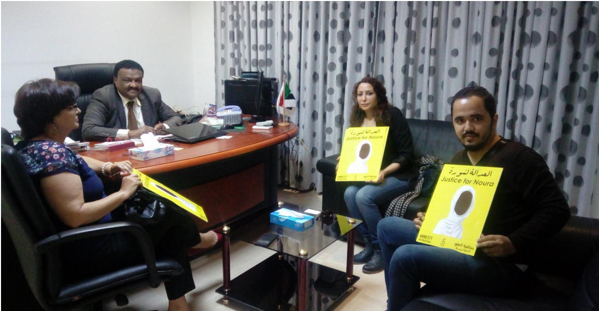
Figura iii Confraternização da manifestação entre a delegação da AI e o representante do Sudão