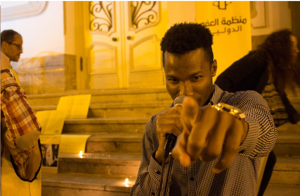
Figura vi. Cantando pela liberdade