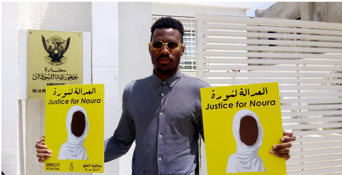
Figura ii. Manifesto referente à libertação de Noura