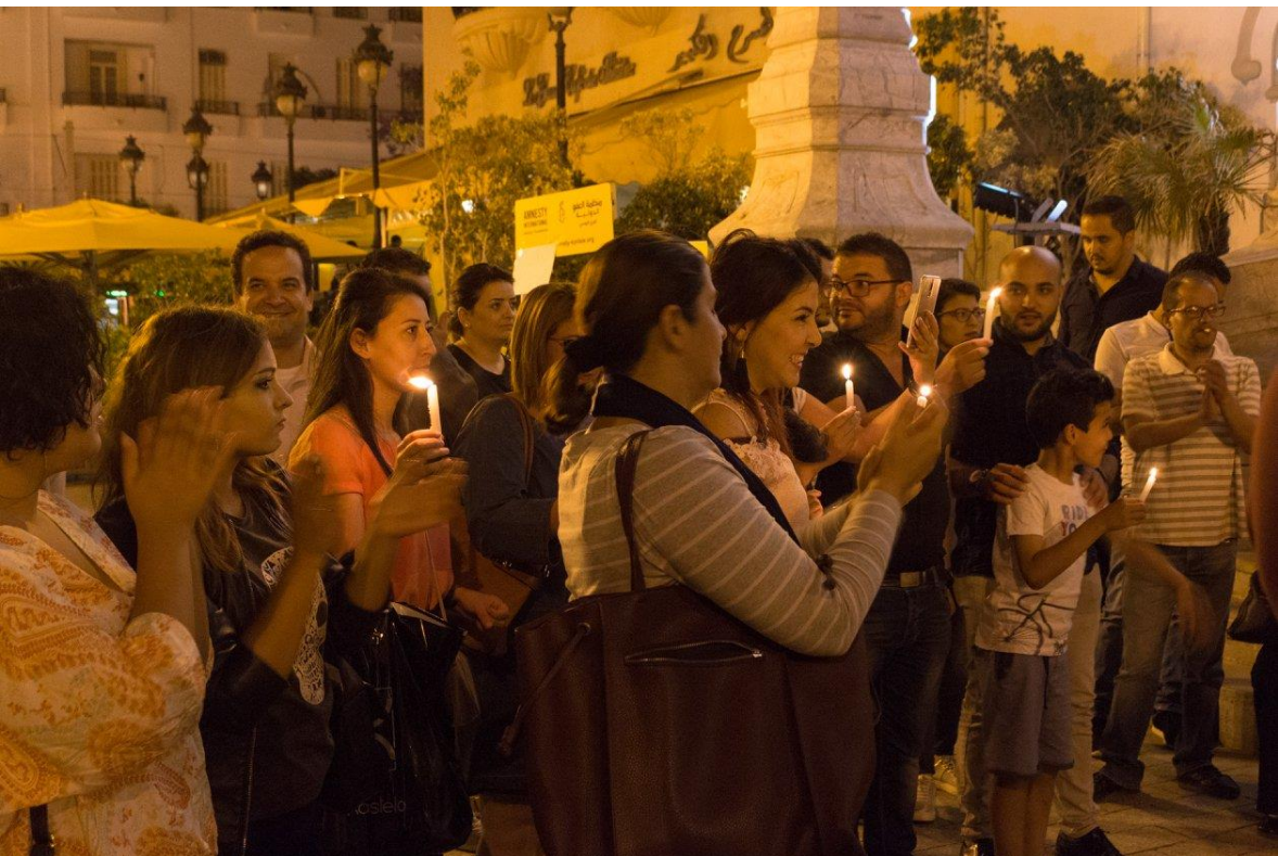
Figura iv. Manifesto na avenida principal da Tunísia, com o objetivo de conscientizar as pessoas sobre as injustiças e violações dos direitos humanos no mundo