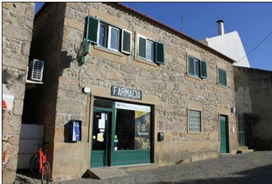
Figura 1 - Espaço exterior da farmácia (retirada a 06/08/2017)

bastante acolhedor onde o atendimento ao público possui uma grande variedade de produtos de saúde e bem-estar. Poder-se-á encontrar vários expositores de balcão entre os dois locais de atendimento e vários panfletos e cartazes, com informação para o utente.