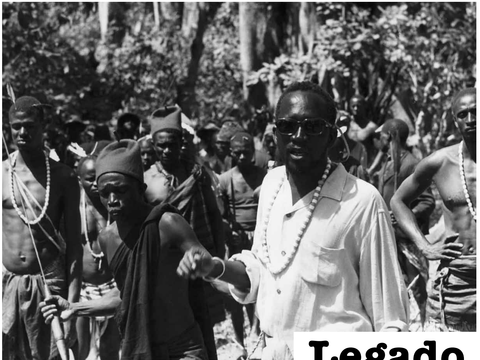
Ousmane Sembène durante a rodagem de Emitrai (1971)