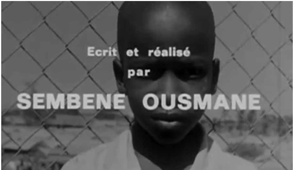
La Noire de... (1966)