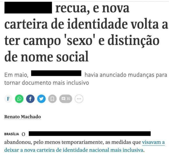
Figura 2 – Notícia online do Jornal Folha de São Paulo 54

Palavras ocultas: Governo, Ministério da Gestão, governo, presidente Luiz Inácio Lula da Silva (PT).