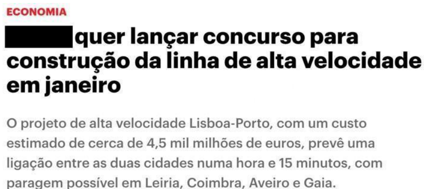
Figura 3 – Notícia online do jornal “SIC Notícias”