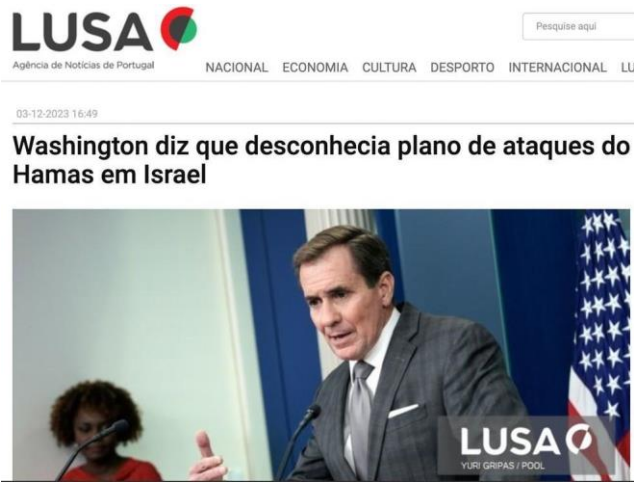
Figura 1 – Notícia da Agência de Notícias de Portugal (Lusa) 53

Peça que leiam os artigos e identifiquem elementos-chave, como tom, escolha de palavras e ênfases. Apresentem as questões como as listadas abaixo para que respondam e possam dialogar com a turma.