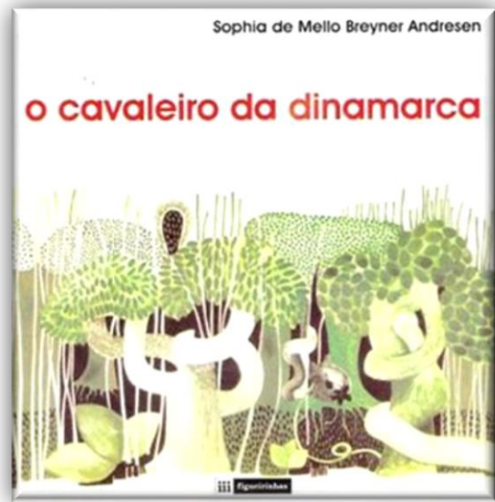
Imagem 1 – Capa do livro

Nesta parte do relatório, irão ser apresentadas diferentes abordagens à leitura integral e orientada de O Cavaleiro da Dinamarca , marco da literatura juvenil em Portugal, escrita por Sophia de Mello Breyner Andresen. Esta obra encontra-se na lista das obras recomendadas pelo Plano Nacional de Leitura, sendo uma das opções presentes no programa de Língua Portuguesa no sétimo ano de escolaridade.