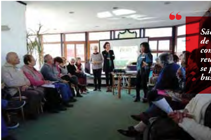
Encontro nacional de outono de Graal. (2)

tismo, alargue cada vez mais as suas extremas, a partir de dentro, para que in omnibus caritas . Eles celebram existencialmente a partilha, transgredindo essas linhas imaginárias inexistentes, justamente chamadas fronteiras. A saber, o Graal-Movimento Internacional de Mulheres; o movimento Nós Somos Igreja; o Fraternitas Movimento, que reúne padres dispensados do ministério e suas famílias; o Metanoia-Movimento Católico de Profissionais; Rumos Novos-Católicos Homossexuais, e Riacho. Estes movimentos desenham geometrias que amiúde se cruzam e encontram em causas comuns. E não esgotam, naturalmente, as experiências e a imensa riqueza do solo fértil desses espaços de fronteira. Porque o Espírito sopra onde quer.