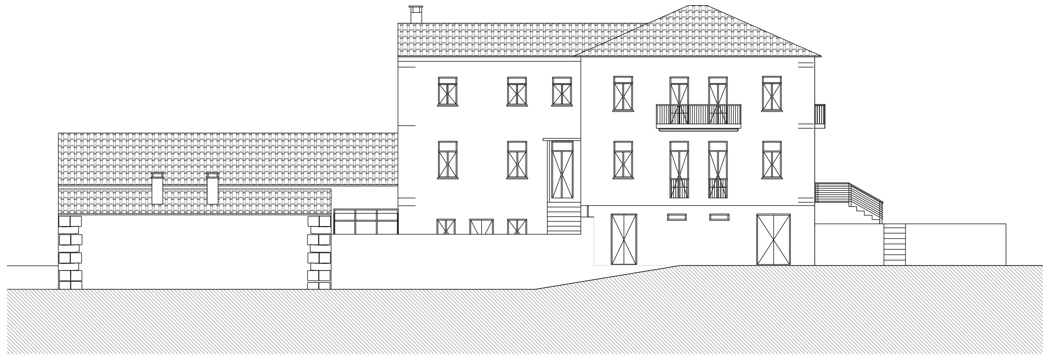
Alçado Sul/ Levantamento