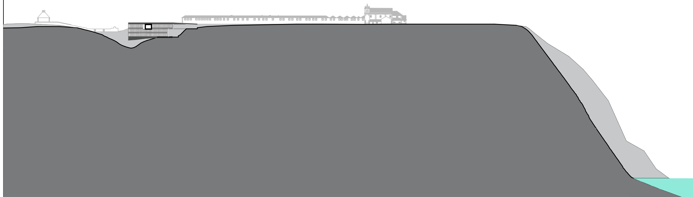
Cortes Logitudinal B/B'