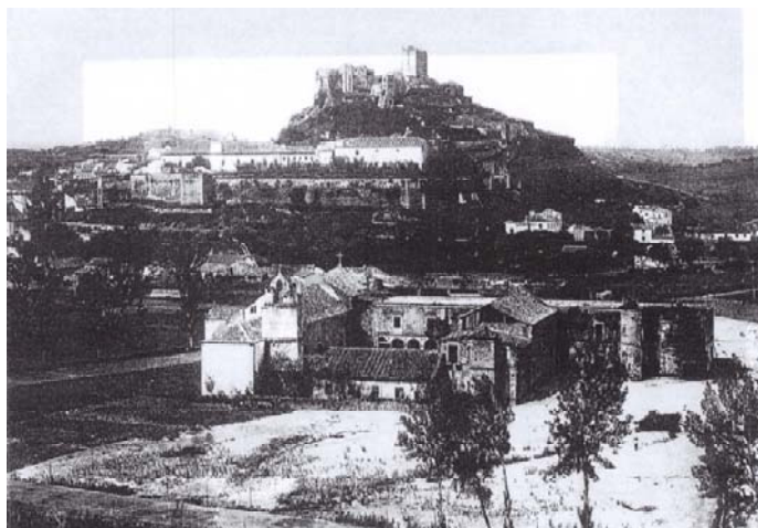
Figura 2 – Convento de São Francisco (alçado nascente)

Em 1855, o edifício do Convento de São Francisco foi cedido à Câmara Municipal de Leiria, com o propósito de aproveitar a sua cantaria para outras obras, mas tal nunca chegou a suceder-se. Entretanto o edifício foi arrendado por diversas ocasiões e em 1866 foi ali instalada a cadeia que não perdurou muito neste edifício.