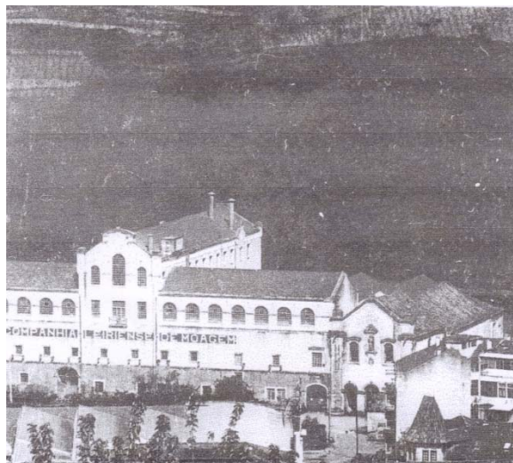
Figura 2 – Companhia Leiriense de Moagem (1950)