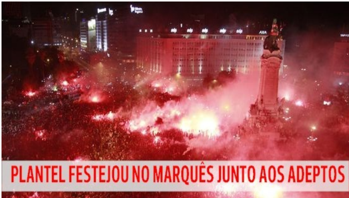
Figura 1: Festejos dos adeptos do Benfica no Marquês de Pombal, Lisboa