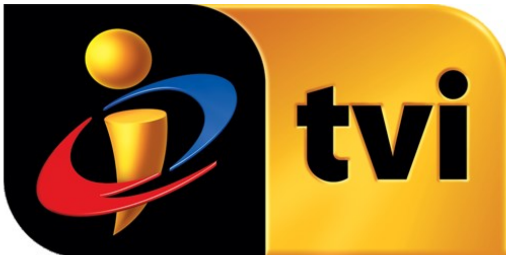
Figura 2: Logotipo da empresa

A Televisão Independente (TVI) é a segunda estação televisiva de índole privada. As suas emissões começaram experimentalmente a 20 de Fevereiro de 1993. Inicialmente era identificado pelo número “4” que representava exatamente a sua posição como 4ª rede nacional de televisão.