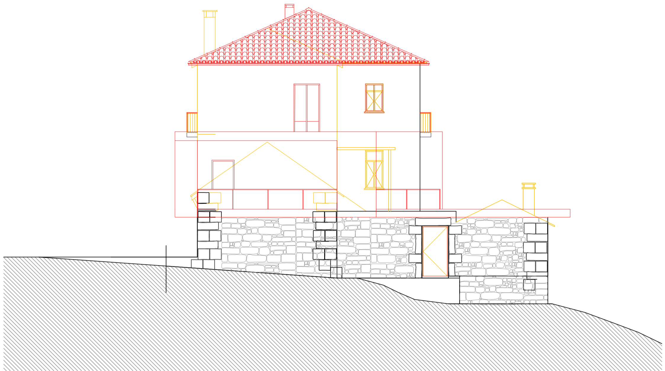
Alçado Poente Existente