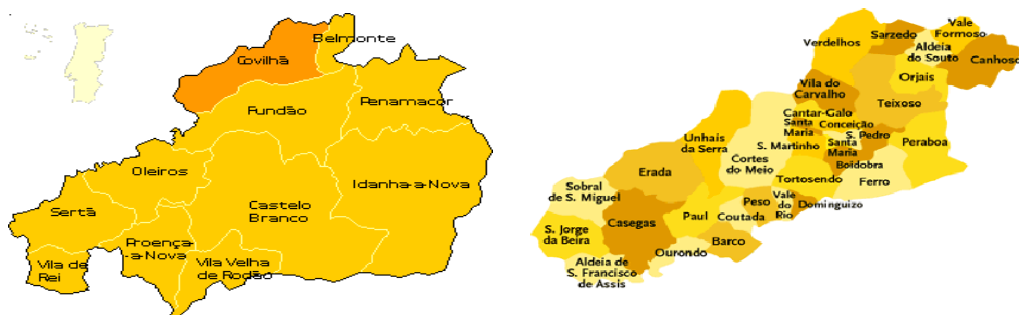
Fig. 2-Mapa de freguesias da Covilhã.

A partir de 1970 inicia-se um processo que conduziu ao abandono sucessivo de numerosas fábricas e à reconversão industrial da cidade. Atualmente a grande crise nos lanifícios levou à necessidade de um conjunto de ações, alterando o panorama económico da região. Ações essas, que passam pela preservar do património industrial e pela criação de espaços culturais, com o objetivo de preservar a memória da indústria dos lanifícios e proporcionar aos habitantes da cidade um maior envolvimento social. Um desses grandes exemplos é a UBI (Universidade da Beira Interior), constituindo um projeto dinâmico, que trouxe novamente visibilidade e revitalizou a cidade, fortalecendo o sector terciário. Um sector que reflete o desenvolvimento da economia local no aumento do consumo de bens e serviços permitindo a melhoria do nível de vida. A par dos investimentos em infraestruturas, acessibilidades, cultura, educação e turismo, cresceram também dois grandes centros industriais, que são o caso de Tortosendo e Canhoso, como mostra a figura 35.