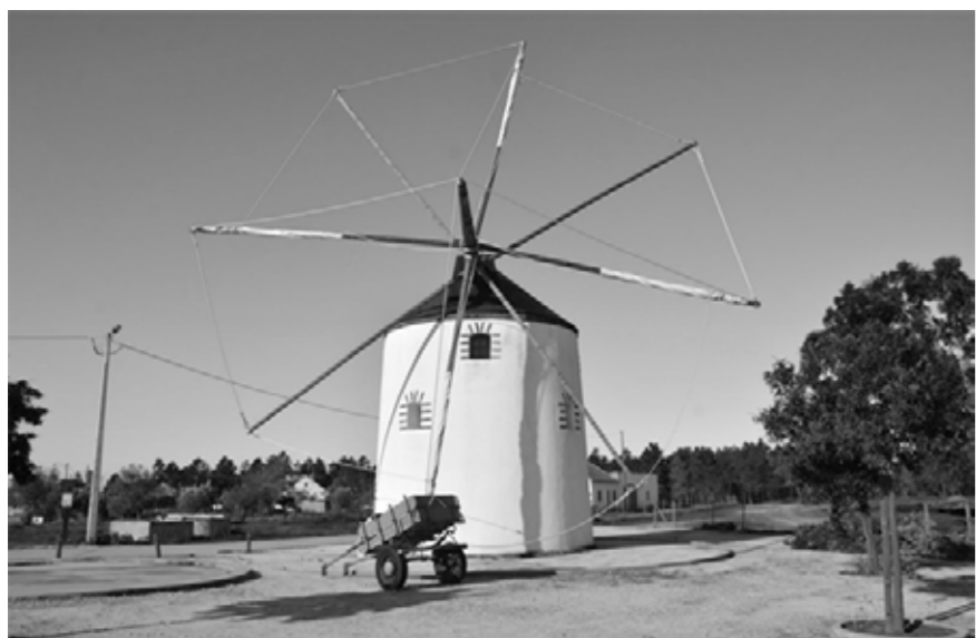
01 - Moinho de Vento

O terreno de intervenção urbana é acessível por quatro ruas que permitem a comunicação directa, ligando a aldeia ao espaço público proposto.