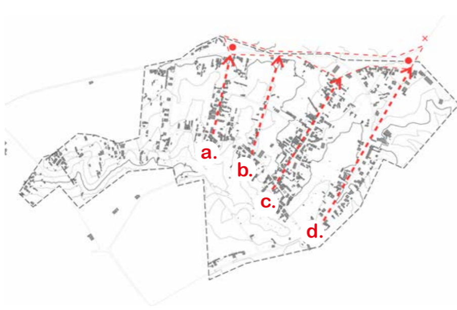
Identificação dos arruamentos que confinam com o local de intervenção.