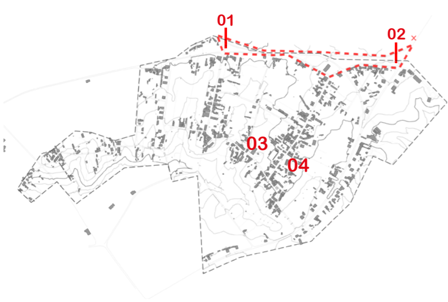
Identificação dos elementos simbólicos

No núcleo urbano norte verifica-se uma maior consolidação urbana, por esse motivo optou-se por intervir neste núcleo numa área que se encontra desocupada.