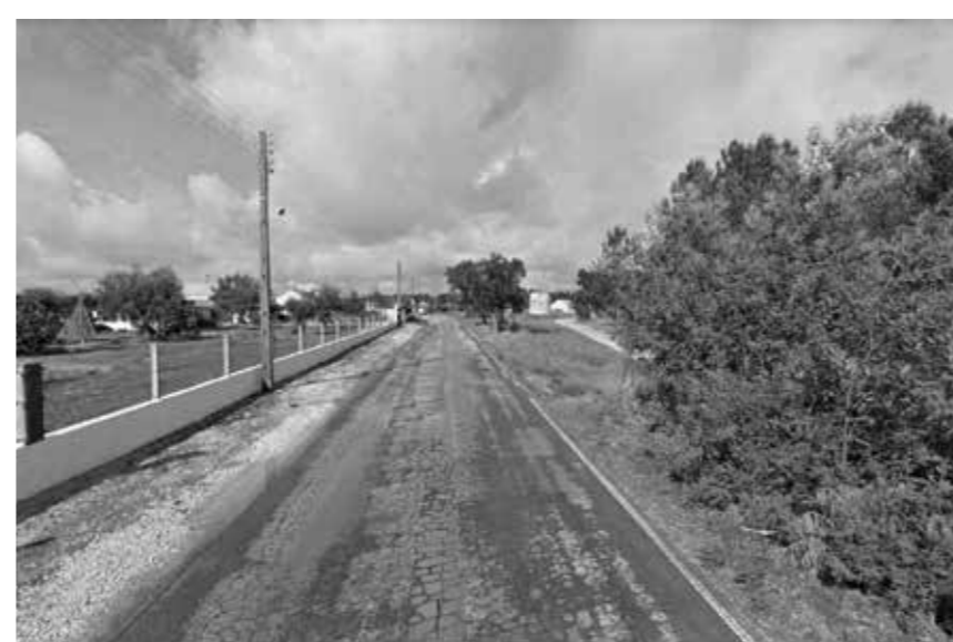
ft.4- fotografia 4