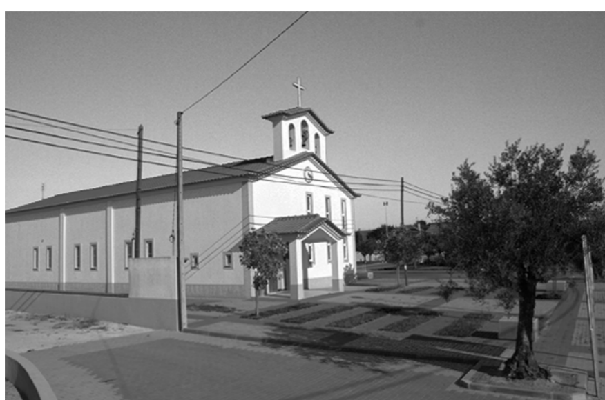
03 - Igreja de Santa Maria