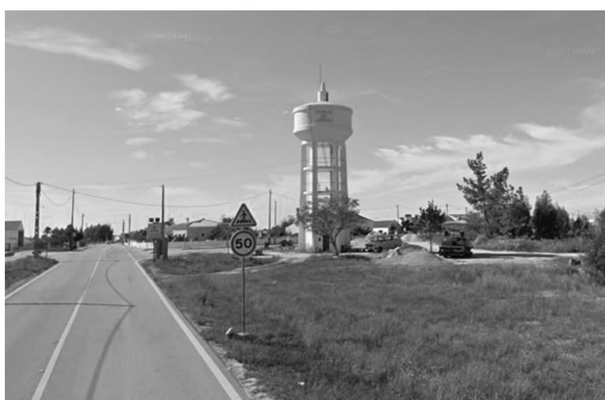
02 - Reservatório de água