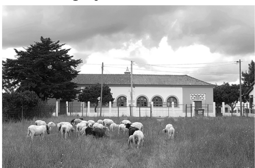
04 - Escola Primária