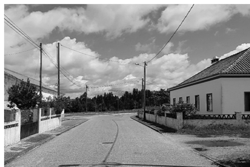
c. Rua Avenida da Liberdade