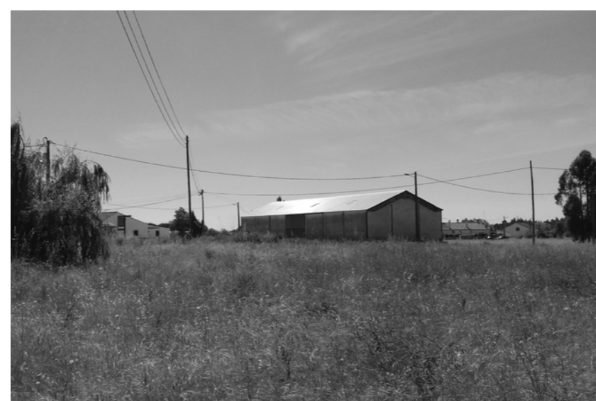
ft.2- fotografia 2