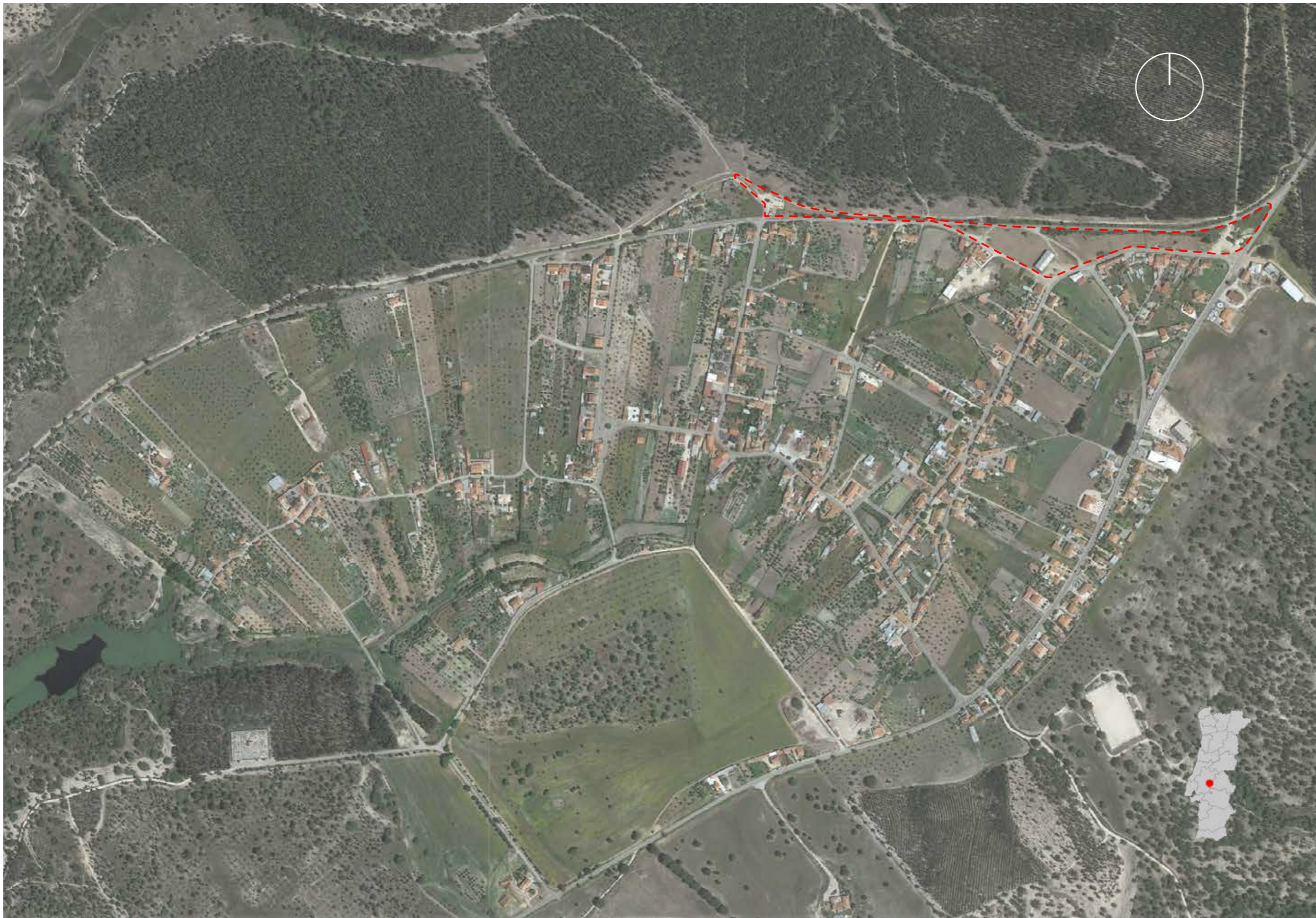
Planta de localização esc. 1/1000 - Núcleo Urbano Norte de Foros de Arrão