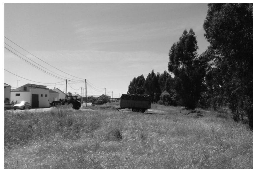
ft.1- fotografia 1