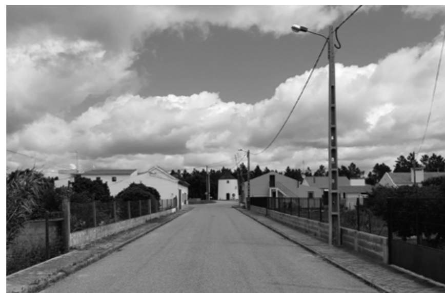
a. Rua Moinho de Vento