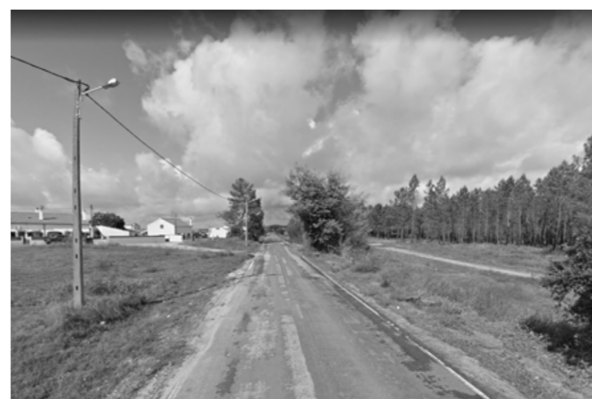
ft.3- fotografia 3