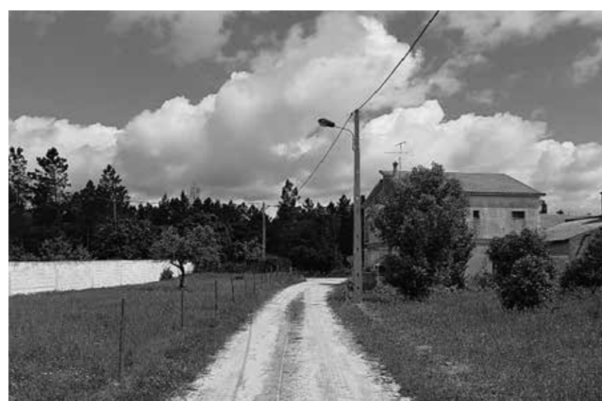
b. Rua Sidónio Pais