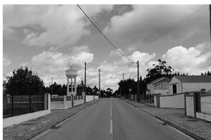
d. Rua EN243