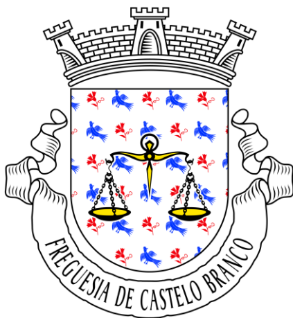
Figura 1 Brasão da freguesia

Para além disso, o site contém a mensagem do presidente, a composição do executivo e seus pelouros atribuídos, documentos de gestão, a data das reuniões públicas e privadas do executivo. O cidadão pode assistir às reuniões públicas. No site, o visitante tem acesso aos regulamentos, editais, a história da freguesia e ao mapa da mesma. Por fim, são disponibilizados também a composição da assembleia de freguesia e as respetivas convocatórias para as suas assembleias e reuniões.